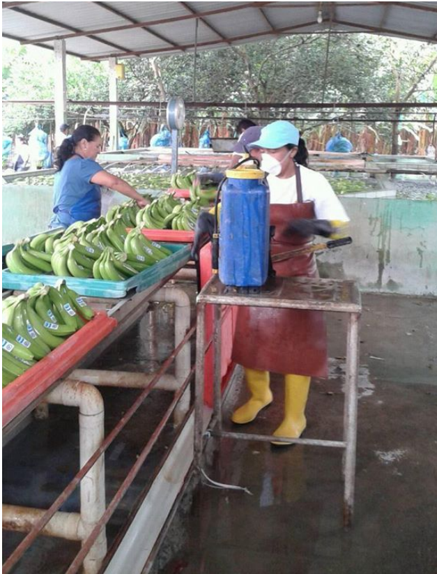
Figura 3.1. Mujeres en el trabajo manual.

asunto de vitalidad y predisposición para ejercer. Así mismo, en cuanto al pago, las mujeres reciben menos por su trabajo, por ejemplo, ellas ganan de 22 a 24 dólares por un día de trabajo, mientras que ellos reciben de 29 a 35 dólares por una jornada (día) de labores.