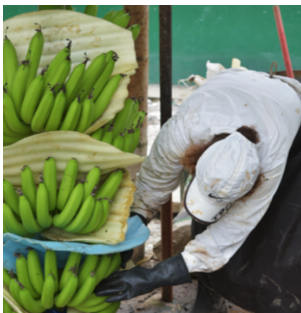
Figura 3.2. Trans en el trabajo bananero.

En este sentido, mientras los hombres ganan un valor por encima de los 22 dólares, 7 las mujeres y los transfemeninos ganan un poco menos que la media, recordemos que no en todos los casos se da, pero es una tendencia importante de resaltar. Esto sin contar que por lo general siempre el capataz o encargado de llevar el personal es siempre masculino y maneja otros valores por encima del que gana cualquier otro trabajador o trabajadora, más el poder simbólico que le representa ser el encargado directo del dueño de la finca o hacienda. Por consiguiente, los roles de género se marcan aún más en el trabajo rural bananero y se acentúan de manera evidente en los pagos por los roles que se asigna/atribuyen dentro del trabajo, reconociendo un grado de inferioridad y feminización a las transfemeninas.