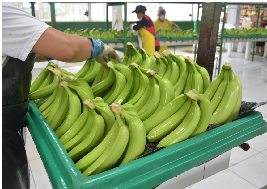
Figura 4.1. Trabajo manual de mujeres y trans en el banano.