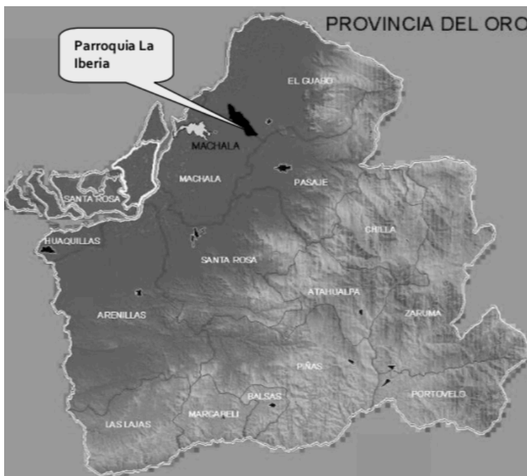
Figura 2.3. Ubicación de la parroquia La Iberia en la provincia de El Oro.