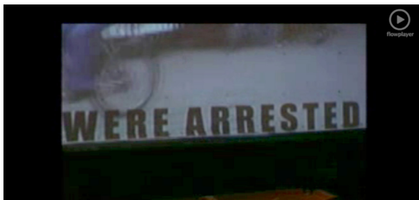
Figura 3. Mudanzas (María Teresa Ponce, 2004)

En una de las secuencias finales del vídeo, aparece la inscripción gráfica “ Were arrested ” (Figura. 3).