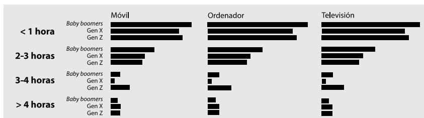
Figura 4. Tiempo de consulta sobre la COVID-19 desde el móvil, ordenador y televisión, al día y por generaciones.

Más de cuatro horas. Menos personas optaron por esta elección. Los datos resultantes no superan el 2% para las tres generaciones.