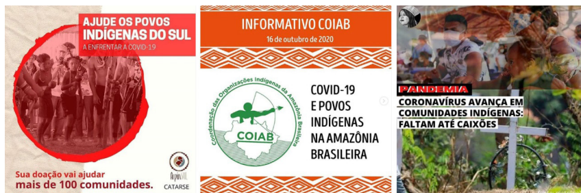
Figura 2: Mosaico de postagens do perfil @apiboficial nos dias 17 (as duas primeiras) e 19 do mês outubro de 2020.