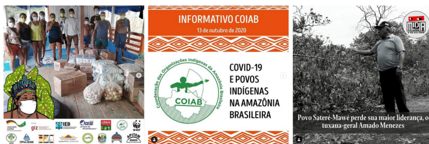
Figura 1: Mosaico de postagens do perfil @mídiaindiaoficial nos dias 9, 14 e 19 do mês de outubro de 2020, respectivamente.

Em julho de 2020 também criou o “Plano de Ação Emergencial de Combate ao Avanço do Coronavírus e de Tratamento entre os Povos Indígenas da Amazônia Brasileira”, uma ferramenta de planejamento e mobilização para a realização de ações conjuntas com lideranças, parceiros, apoiadores e autoridades.