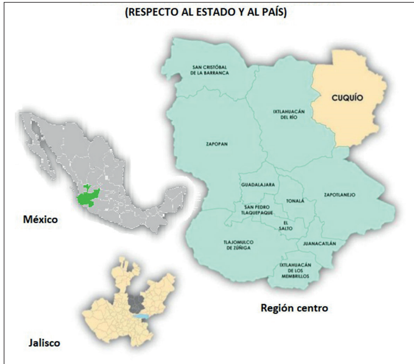
Mapa 1. Localización geográfica de Cuquío

Elaboración propia con datos de IIEG, 2019.