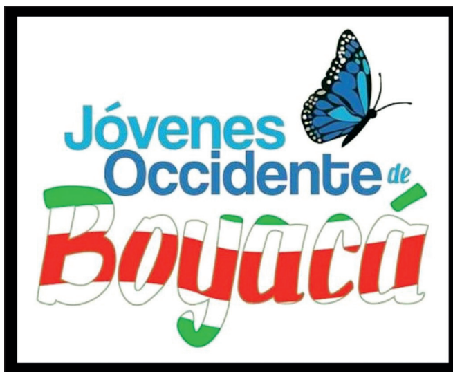
Figura 1. Logo JOB

Además del discurso, JOB se presenta como una organización juvenil de servicio social. Propone un logo que no se vincula a las imágenes reiterativas de la región, la esmeralda o los cerros de Fura y Tena, sino a la imagen de la mariposa azul, 7 especie endógena de la región de Boyacá. En la tipografía del logo predomina el color azul de la mariposa y los colores de la bandera de Boyacá (figura 1).