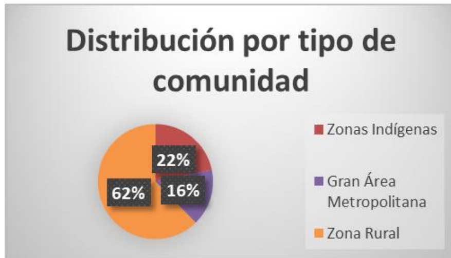
Ilustración 3 Distribución de las escuelas integrales de iniciación deportiva según el tipo de comunidad.

NOTA: Elaboración propia a partir de la información contenida en PANI, Memoria Institucional 2019-2020, p.p. 29-30