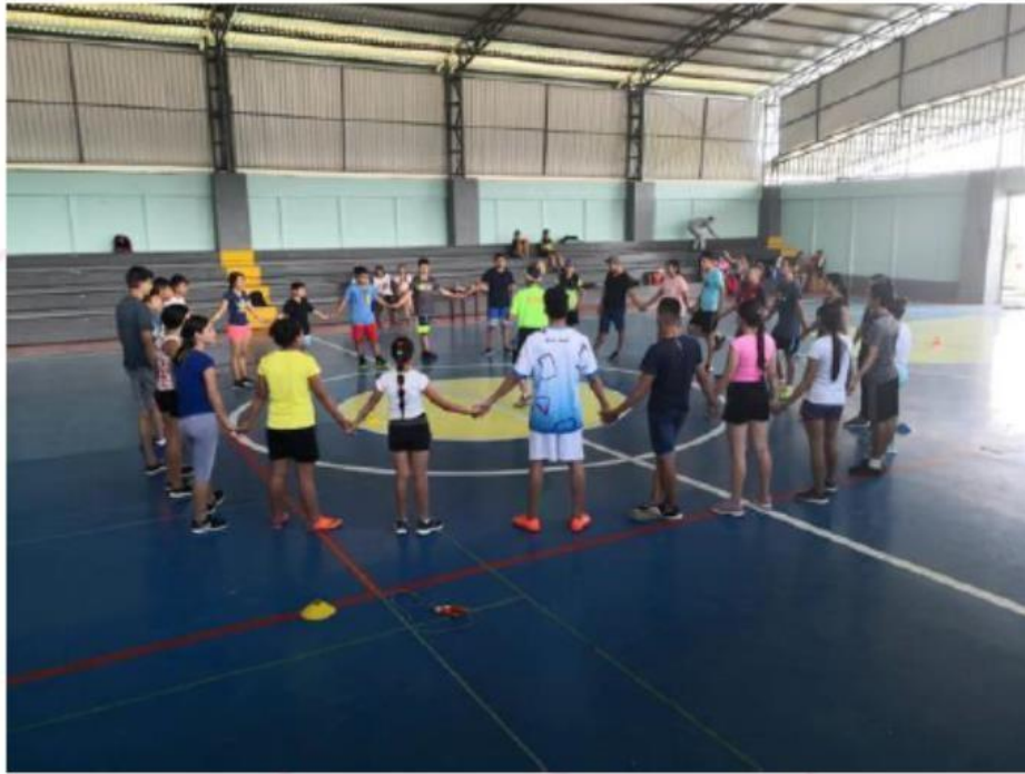
Ilustración 4 Fotografía de evento del programa Escuela Iniciación Deportiva

Nota: Disponible en PANI, Memoria Institucional (2020), p. 29