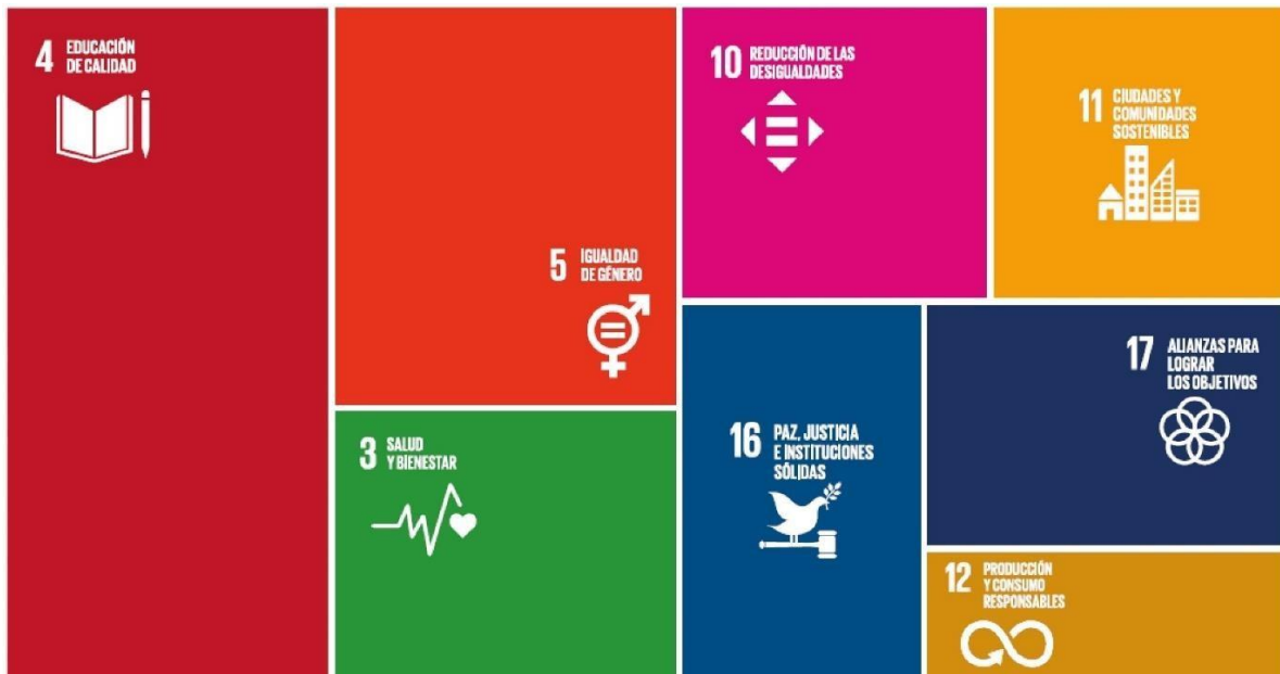
Ilustración 1. Relación del deporte con los ODS.

Nota. Adaptado de “Gráfico 4. Representación gráfica por la relación directa del deporte y las ODS”, de Secretaría General Iberoamericana. “El Deporte como herramienta para el Desarrollo Sostenible. Parte 1”. 2019, p. 17. Disponible en https://issuu.com/segibpdf/docs/segib_cid_deporte_y_ods_-_librillo_1