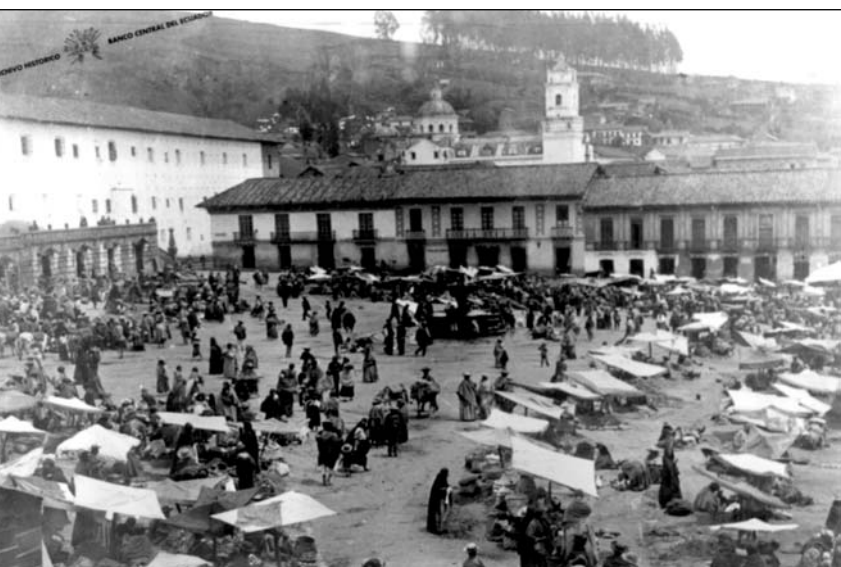
Mercado en la Plaza de San Francisco, hacia 1890.

cidas por las inversiones que se realizan en determinadas zonas de los cascos antiguos. ¿Pero qué se experimenta, cómo y con qué finalidad?