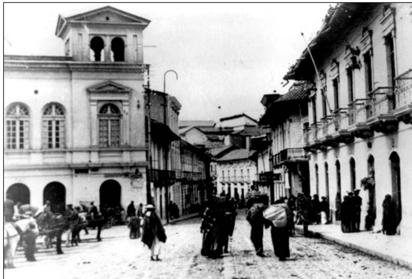
Quito, Plaza del Teatro, hacia 1895.