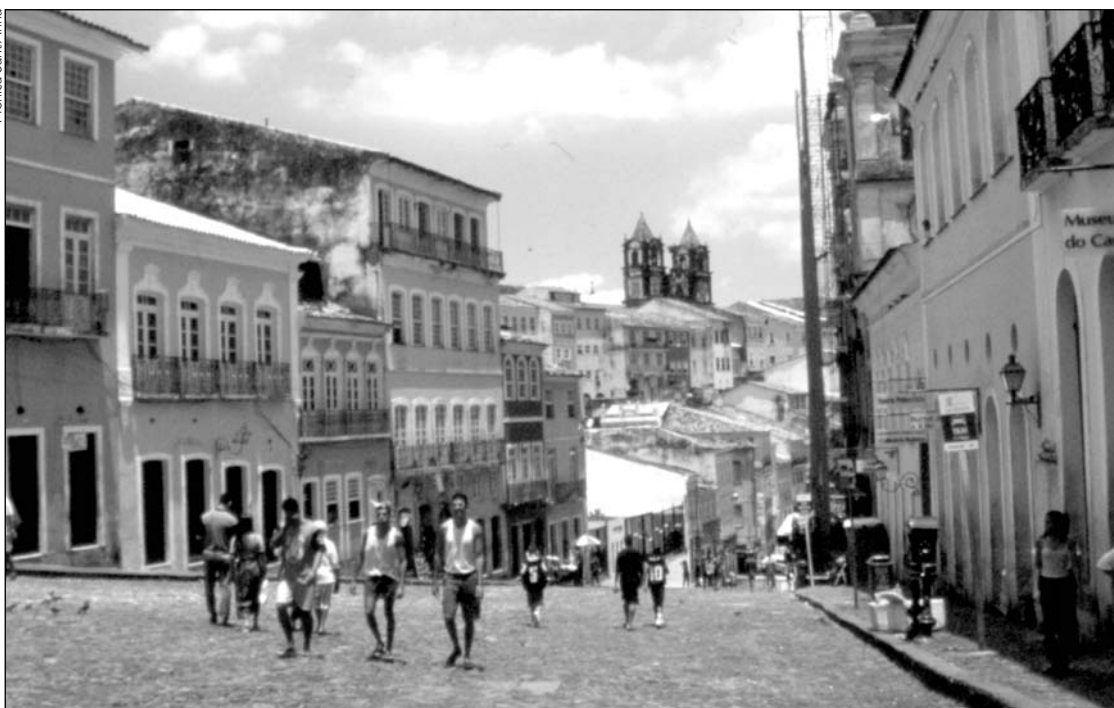
Salvador de Bahia

tauración de algunos importantes monumentos 3 .