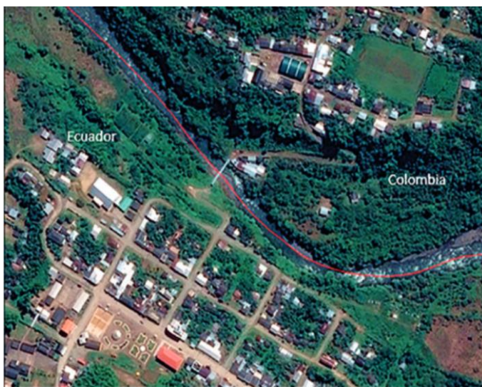
Foto 1.1. Límite fronterizo entre El Chical, Carchi y Tallambí, Nariño