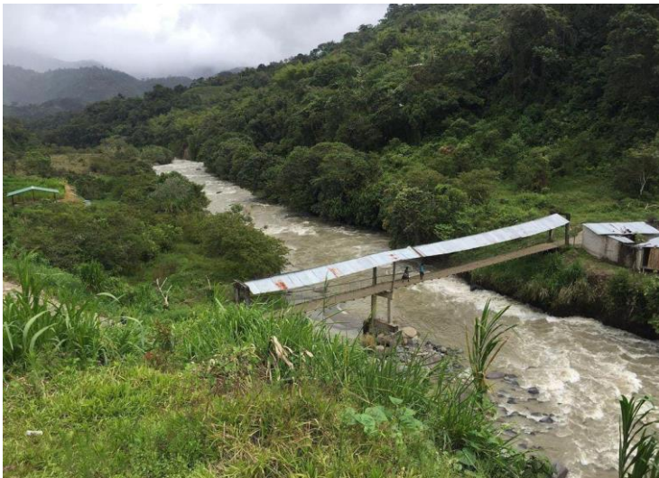
Foto 1.2. Puente fronterizo sobre el Río San Juan entre El Chical, Carchi y Tallambí, Nariño