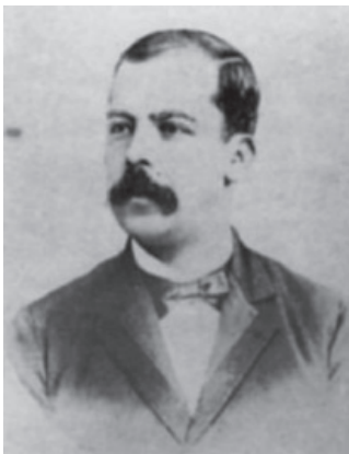
Manuel Estrada Cabrera Presidente de la República (1898-1920)

En este mismo año se estableció la primera unión entre fútbol y política, aspecto que influyó en su propagación por todo el país. Durante las Fiestas de Minerva, y más específicamente en los días 29 y 30 de octubre, el fútbol fue sancionado como “deporte nacional”. A las nueve de la mañana de la primera fecha en el Campo de Minerva, se jugó el partido entre los equipos del club de fútbol de la Escuela Práctica de Varones, imponiéndose el cuadro deportivo del equipo Sidney al del Virginia. Al día siguiente se efectuó el encuentro entre los clubes Gay y Olympic, partido del cual saldría el primer campeón de Guatemala, el Club Gay. Las esposas de los embajadores de Brasil y El Salvador, por encargo del presidente Estrada Cabrera, entregaron las copas de plata que el mandatario obsequió a los centros deportivos en el orden antes mencionado. 15 La intención del mandatario con este acto era la de obtener buena imagen, debido al fraude electoral que marcó su segunda reelección y la represión a toda oposición política que caracterizó sus 22 años en el poder. Este gobernante inauguró un nuevo estilo de gobierno basado en el quiebre de la hegemonía altense ocurrida con el triunfo revolucionario liberal de 1871. 16