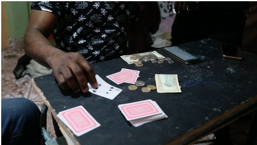
Imagen 4.4 Escena del juego de cartas