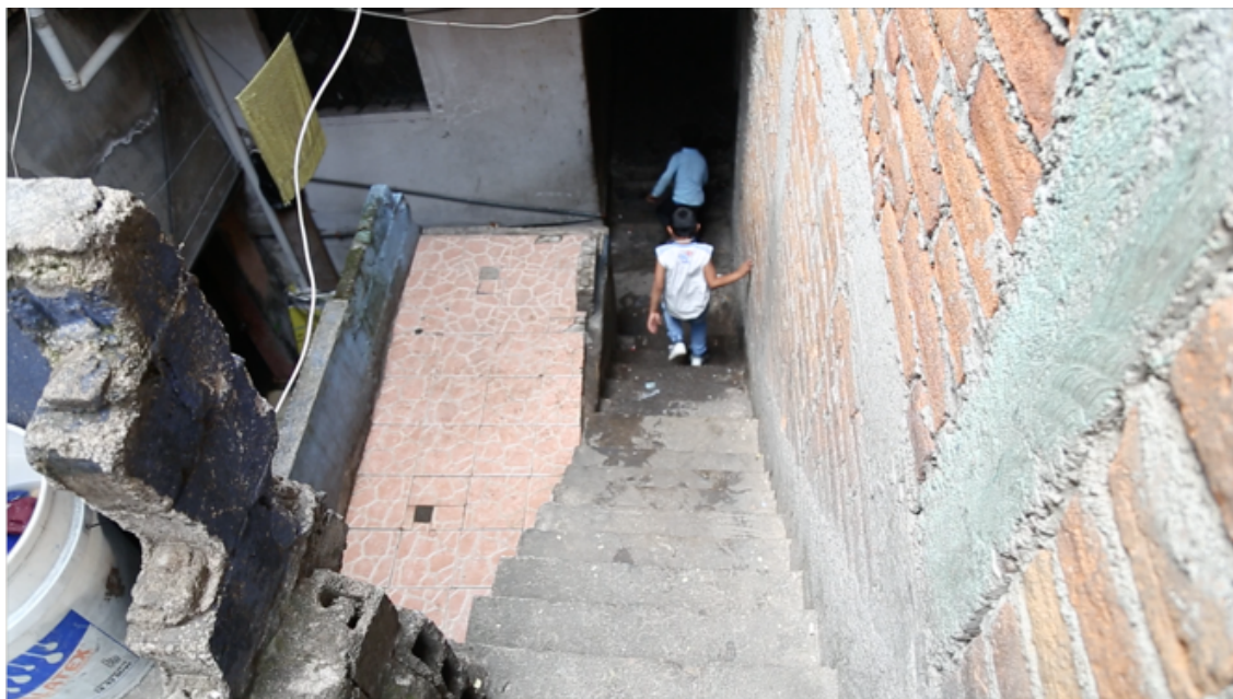
Imagen 1.2 Escaleras de la casa ubicada en el barrio la Tola en el Centro de Quito

Llevé esta conversación de manera intuitiva pues no había previsto que el reconocimiento de la Universidad Nacional como lugar de estudiantes de izquierda fuera motivo de conversación o que incidiera en la relación con quienes iba a trabajar. Sin embargo, para John F. Kennedy esto parecía un dato importante, por lo cual había preferido adelantarse para saber quién era y qué intereses tenía el colombiano que había llegado con el periodista mexicano, pues el diálogo entre colombianos tenía que ser distinto, habría posiciones por aclarar, información que debía reservarse, tensiones por tratar y confianza por construir. En adelante el diálogo se posicionó como elemento central y fin último del ejercicio, de esto se trataría todo lo que hiciéramos, de lograr el intercambio, información, opiniones, comentarios, acciones y anécdotas. No necesariamente porque fuésemos los más radicales en nuestras posturas políticas, las cuales ni siquiera habíamos expuesto más allá de los epítetos de izquierda y derecha, sino porque teníamos trayectorias distintas que nos ubicaban en medio de representaciones políticas estructuradas de manera opuesta y en torno a elementos comunes como nuestro país, su historia y sus actores.