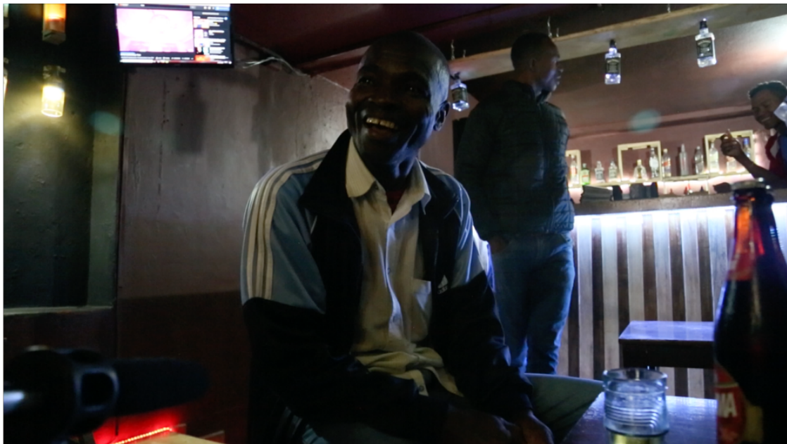
Imagen 1.6 El Viejo durante el rodaje de la película en un bar

Mientras buscaba el camino de regreso, El Viejo fue encontrado por gente asociada a quienes lo amenazaron en el Cauca y aunque intentó desesperadamente obtener protección de las instituciones estatales, incluidos el Ejército y la Policía, no pudo acceder a ninguna medida. Finalmente, no le quedó más opción que seguir huyendo con la ayuda desinteresada de algunas personas, en particular de personas negras como él, quienes habitaban en esa región donde su presencia es minoritaria.