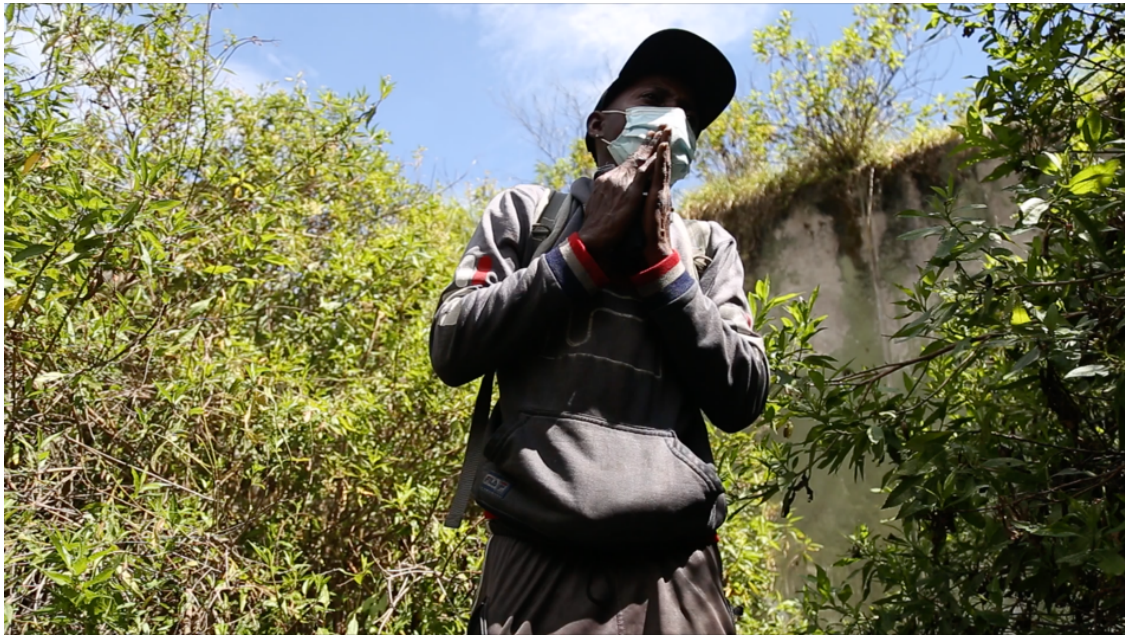
Imagen 4.3 Cenizo en el rodaje de la película