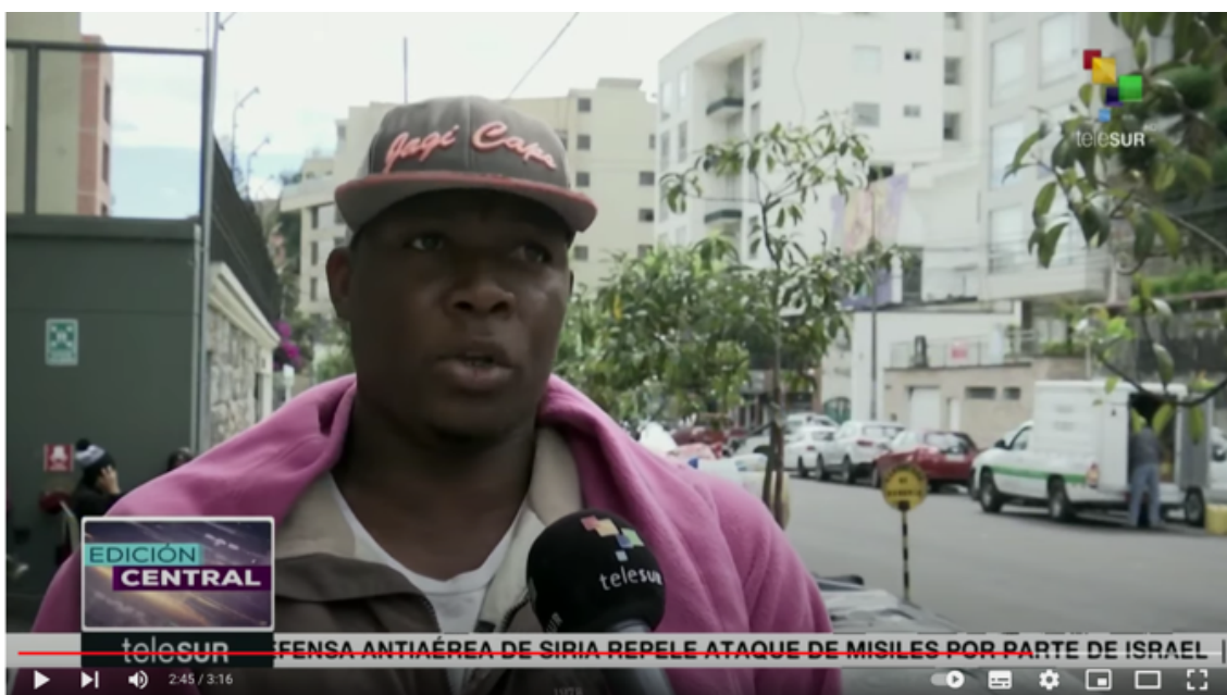
Imagen 3.2 Refugiados frente a ACNUR. Reportaje de Telesur