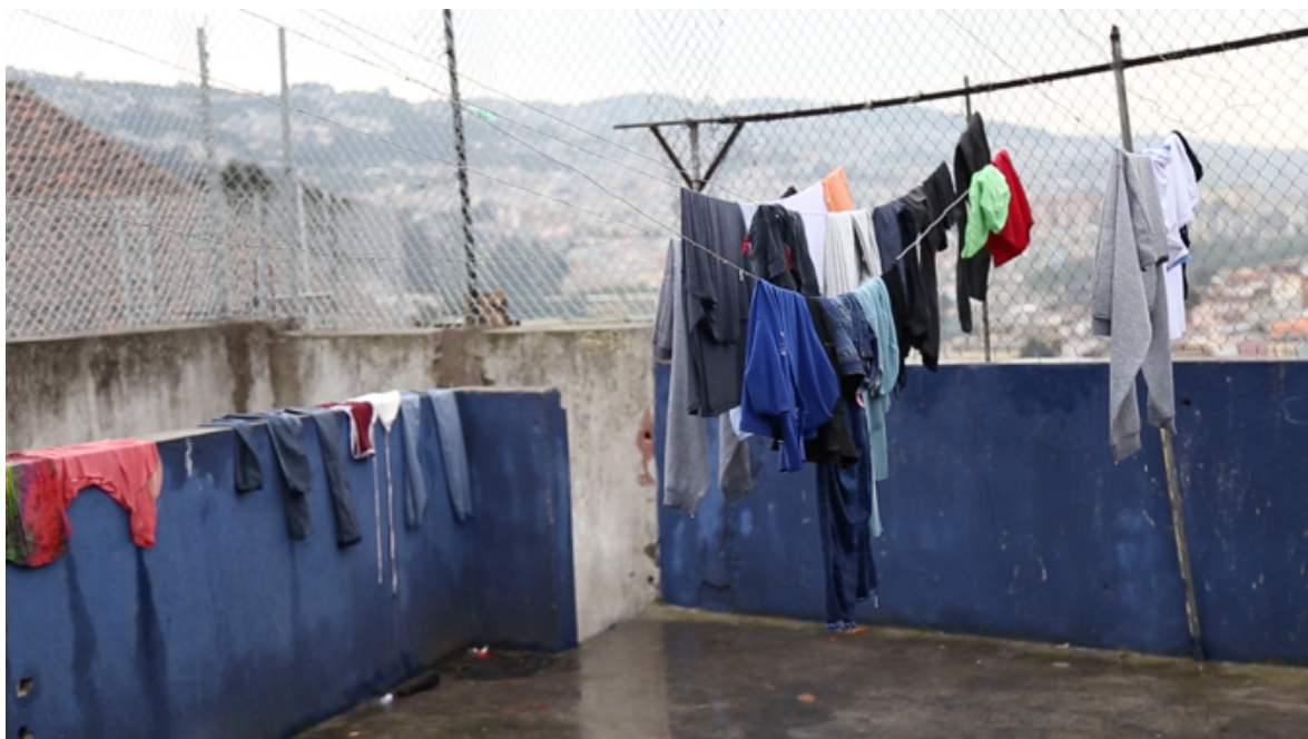
Imagen 1.1 Terraza de la casa ubicada en el barrio la Tola, en el Centro de Quito