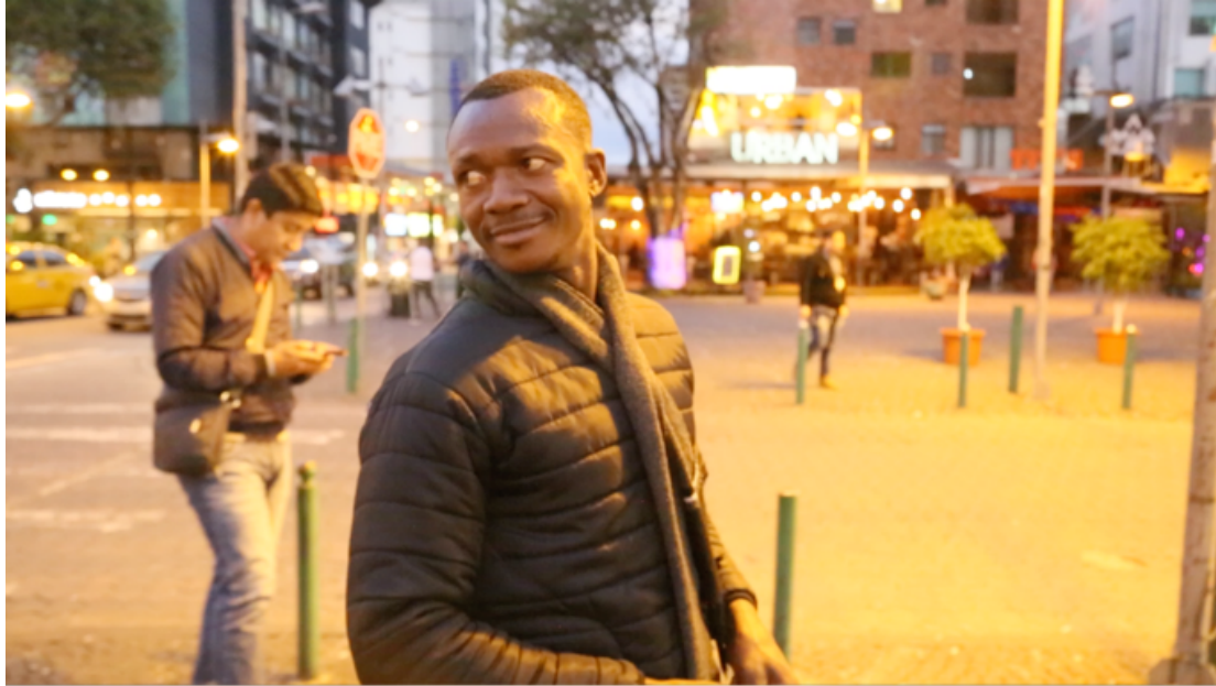
Imagen 1.5 John F. Kennedy en la calle durante rodaje de la película