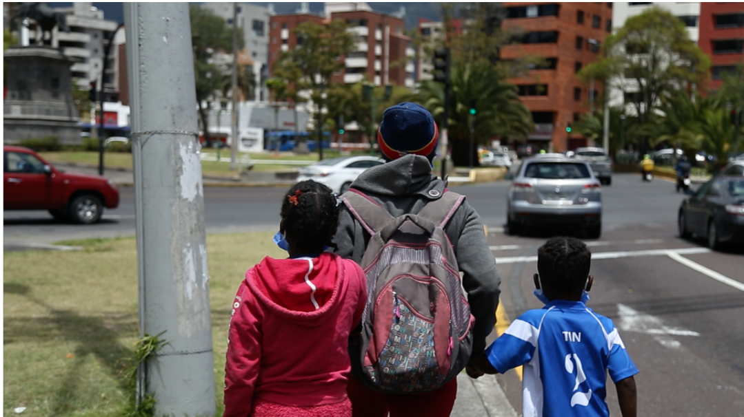
Imagen 4.2 La Reina del Sur en el rodaje de la película junto a sus hijos