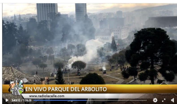
Figura 4.4. Imágenes de la cobertura de Radio La Calle

Acá la represión es brutal, ya no se ve la Casa de la Cultura por la cantidad de gases [...] Las explosiones son tremendas, vamos a subir una foto a las redes sociales [...] porque existe mucha represión en contra de la gente que está en El Arbolito. A pocos minutos de las mesas de diálogo, así prepara el gobierno el mantel para la mesa de diálogo. Con bombas y represión en contra de mujeres, jóvenes y adultos mayores. Existen imágenes que nos llegan de todo el país con la voz de protesta de la ciudadanía. (Extracto de la transmisión de Radio La Calle del domingo 13 de octubre de 2019, tomado de la unidad de análisis 1 415, entre los tiempos: 3:25.01 y 3:34.15) 38 .