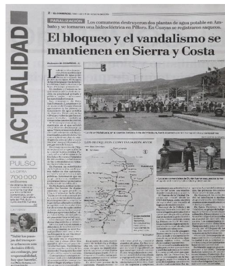
Fuente: El Comercio , 9-10-2019.

Otro resultado relevante de la tabla 4.25 refiere a que apenas con el 0,6%, El Comercio apeló o hizo referencia a los actores mediáticos de las manifestaciones, mientras que Radio La Calle con 10,1% sí apeló a estos actores mediáticos, sobre todo, a los medios tradicionales.