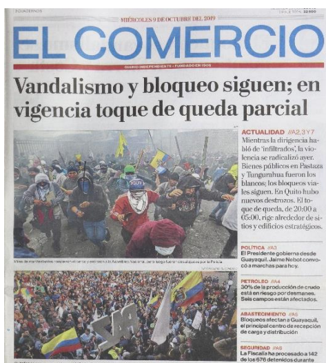
Fuente: El Comercio , 09-10-2019