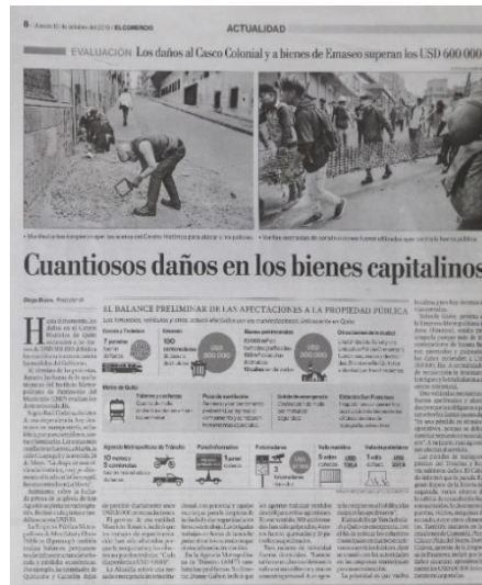
Fuente: El Comercio , 10-11- 2019