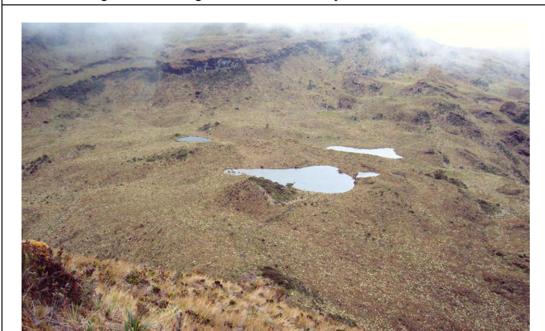
Lagunas de las Reginas (o de Suramérica).