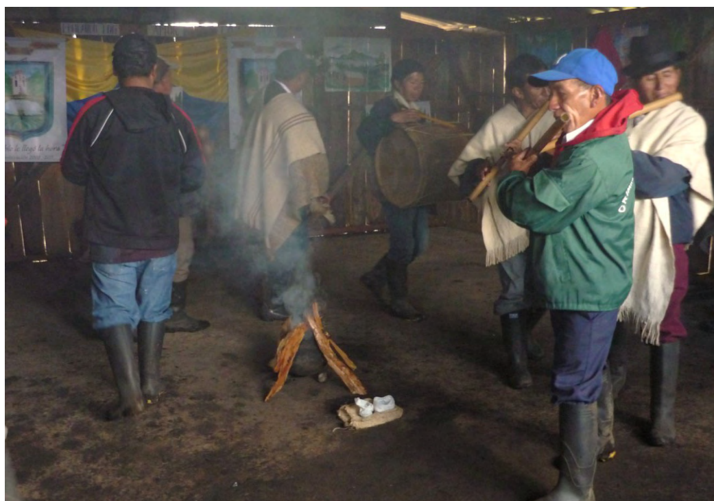
La chirimía armonizando al taita Nina (abuelo fuego).