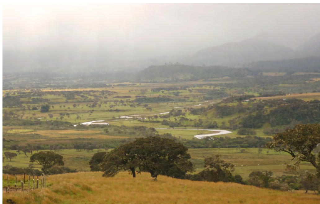
Páramo de las Papas atravesado por el río Caquetá.