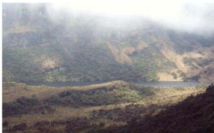
Laguna de Santiago.