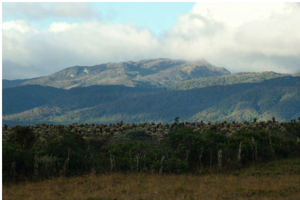
Páramo de la vereda Rionegro, al fondo, la parte de la montaña donde nace el río Caquetá (peña blanca).