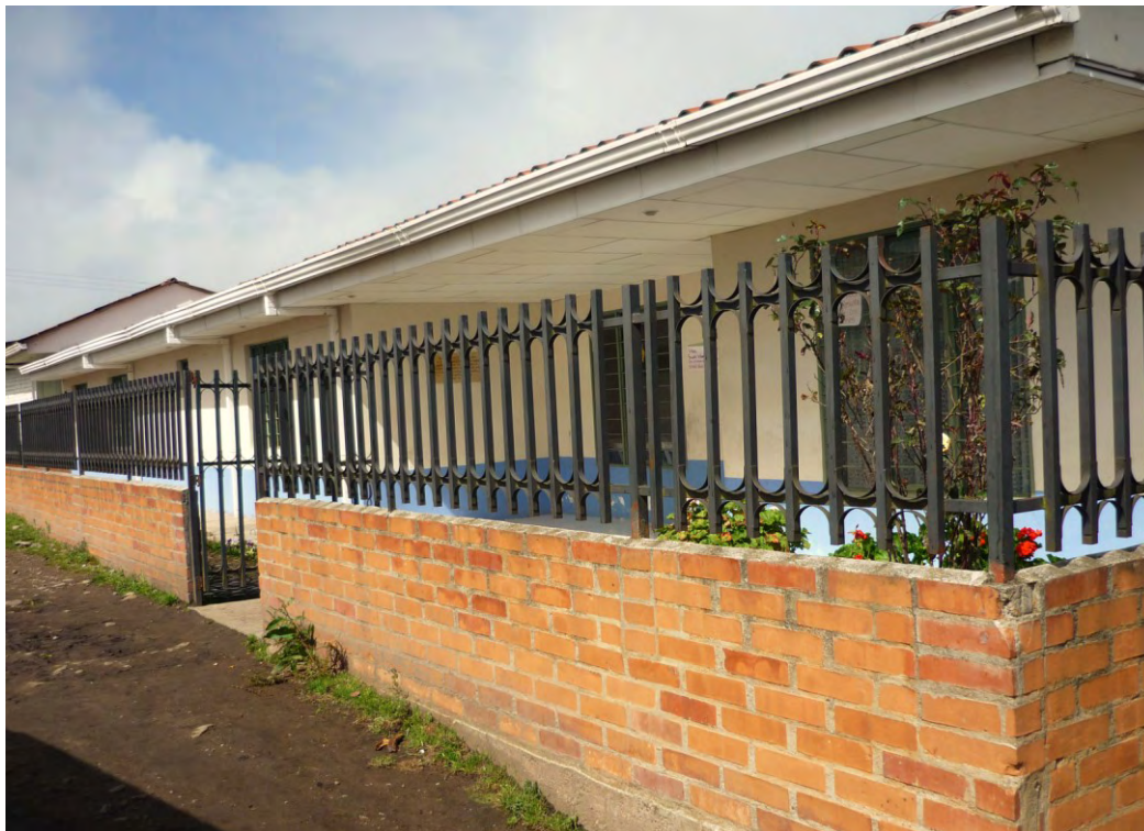
Hospital de Valencia.