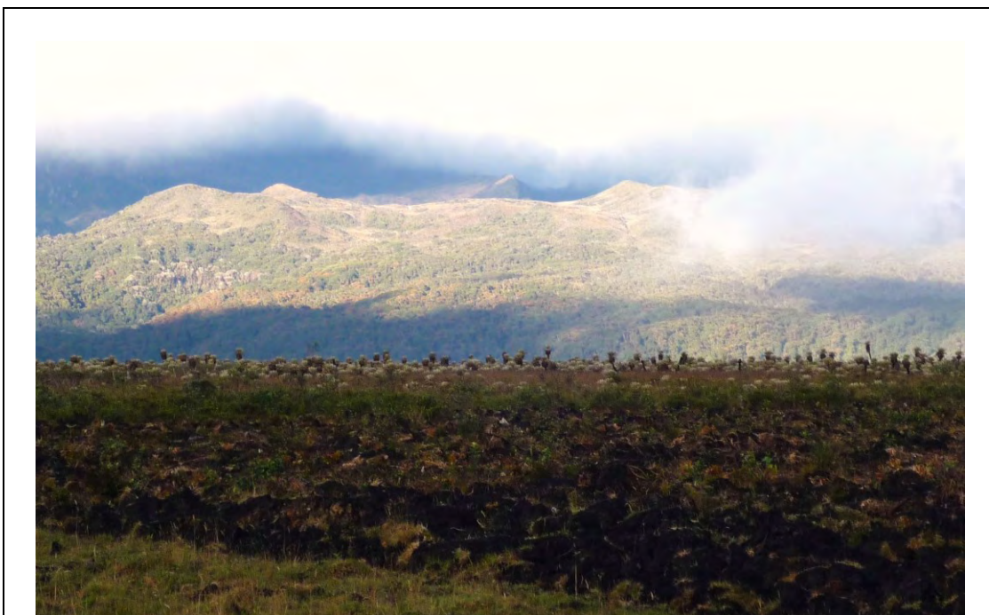
Erosión a un sector del páramo en la vereda de Rionegro, se puede observar la tierra levantada y al fondo los frailejones.