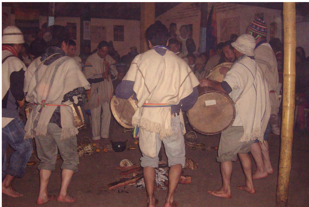
Ritual para agradecer por los alimentos, a través del baile y la música (interpretada por la chirimía). Foto tomada por Oswaldo Muñoz durante un trueque en Valencia.