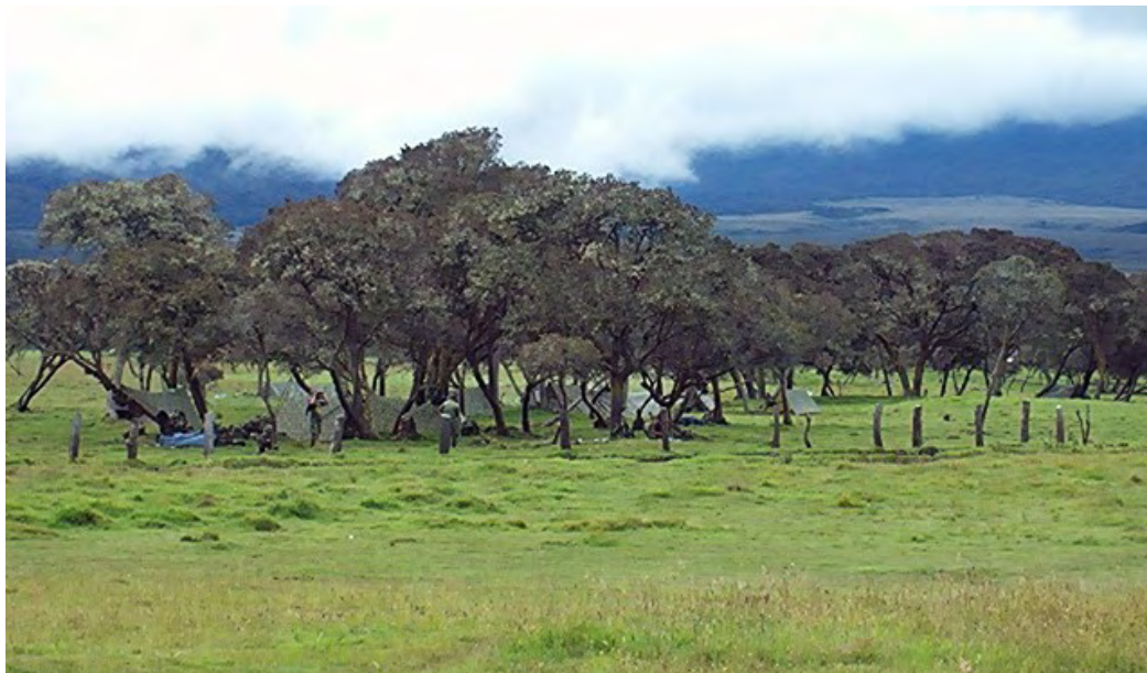
Campamento del ejército en la vereda de El Encino durante una actividad comunitaria.