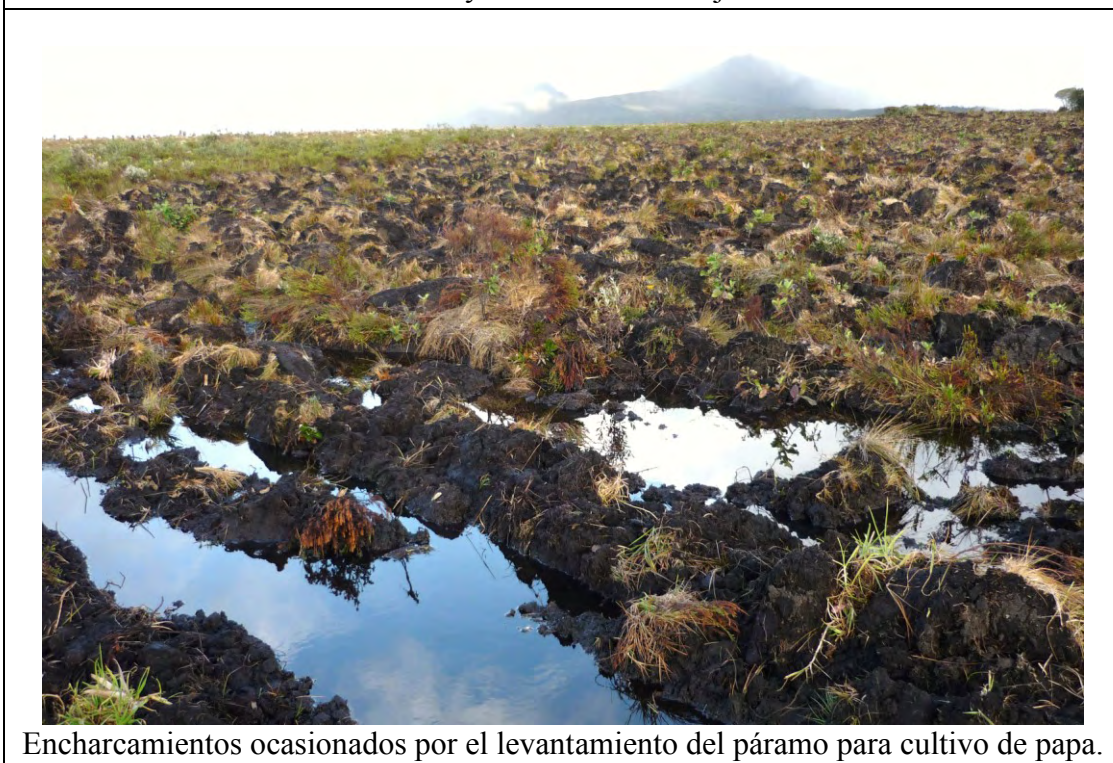
Encharcamientos ocasionados por el levantamiento del páramo para cultivo de papa.