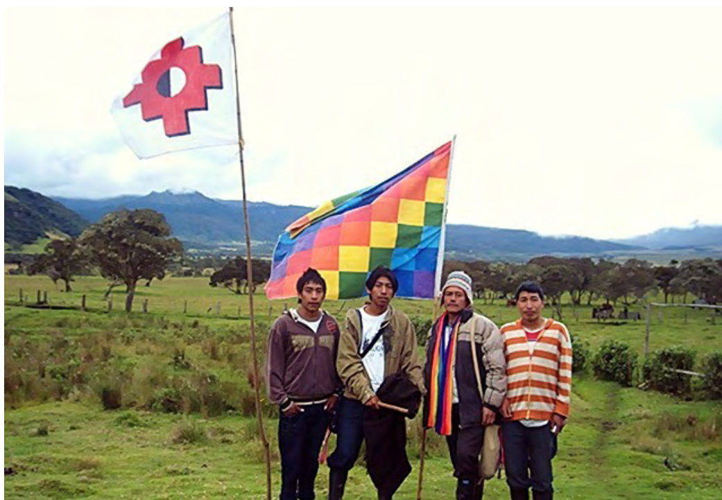
Participantes de la actividad comunitaria, al fondo el campamento del ejército.