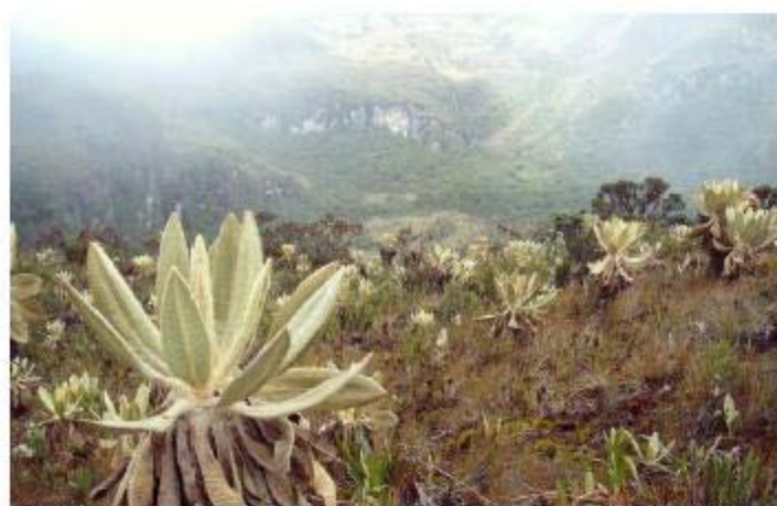
Cajuma que da origen al río Caquetá.