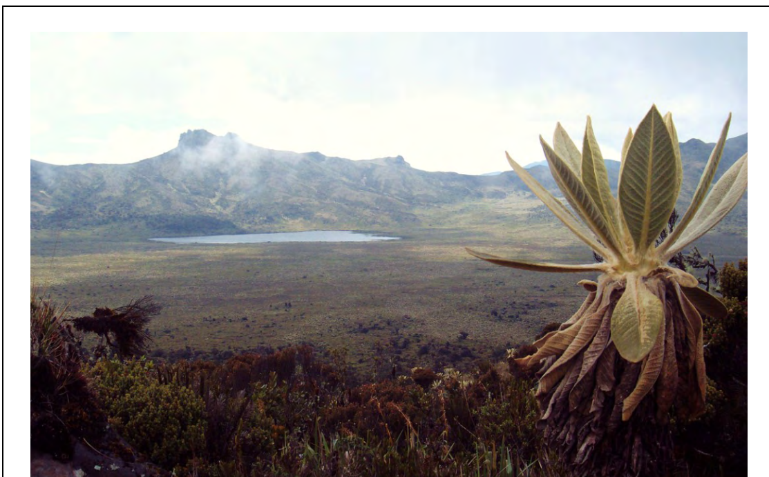
Laguna de La Magdalena.