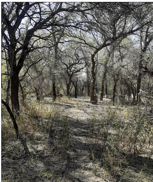
Figura 4. Apiario caracterizado por presencia de monte nativo y microclima. Agosto, 2023