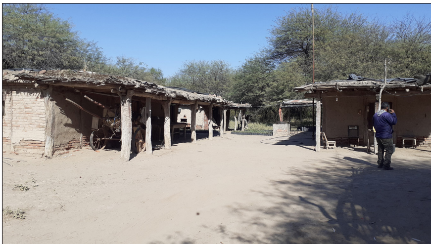
Figura 2. Algunos recursos endógenos en el predio. Agosto, 2023 - Depósito para cosechar miel – Gallinero – Pozo de agua

La familia R dispone de una variedad de herramientas y recursos que, en su mayoría, son de producción artesanal: un depósito para cosecha de miel, una casa para descansar, dos gallineros (con capacidad para 250 gallinas cada uno), un sistema de bebedero con caño de PVC y un tanque pequeño para hidratar a las gallinas; un bebedero de material para los caballos y la vaca y algunas colmenas artesanales elaboradas con tarimas de madera, enjambres y candados.