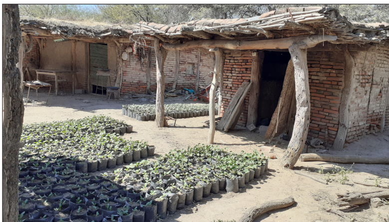
Figura 3. Plantines antes de ser trasplantados. Agosto, 2023