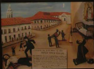
Cuadros de milagros de la Virgen del Quincho.