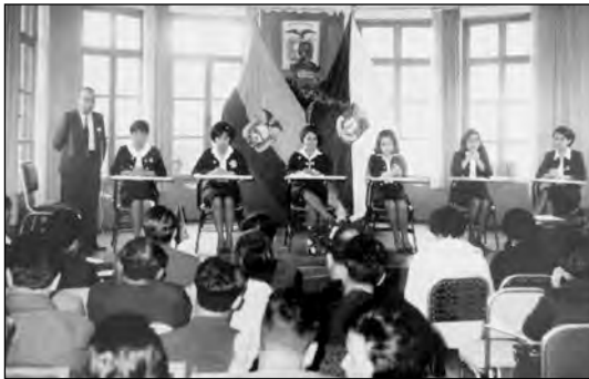
Fig. 33. Debate estudiantil. Biblioteca Colegio Manuela Cañizares.

Los certámenes habían sido utilizados como recurso pedagógico y de difusión del pensamiento católico, sobre todo por los jesuitas, mientras que aquí estaban relacionadas con preocupaciones seculares, educativas, sociales y médicas. Lo más probable es que los temas de los debates no hayan sido definidos por las estudiantes, sino por las maestras en respuesta a preocupaciones ciudadanas de las que ellas mismas eran partícipes: las condiciones de mejoramiento social o individual, la enseñanza pedagógica, la higiene. Pero lo que quiero enfatizar es que a través de estos actos se motivaba a las estudiantes a participar en la vida social y pública. Trato de imaginar el inmenso esfuerzo que suponía organizar cada una de esas sesiones y la importancia que daba el colegio a ello. Un debate es una forma de representación, un evento abierto al público como espectáculo teatral, una extensión de la sabatina escolar pero a otro nivel, no repercute en la opinión pública pero constituye un ensayo para participar en ella. Está organizado de manera formal y ceremonial, como un ritual capaz de instituir una autoridad.