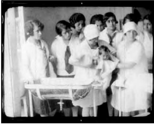
Fig. 25. Clase Práctica de Puericultura en el Colegio Manuela Cañizares. Fotograma de Ecuador Noticiero, dirigido por Manuel Ocaña en 1929.