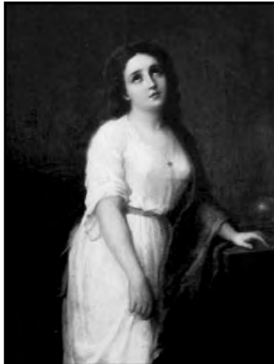
Fig. 3. Dama quiteña, óleo de comienzos de siglo. Anónimo.

La mujer vive y reina unida al hombre, como hija, como esposa o como madre, especialmente desde que la sublimó el Cristianismo. Dios al crearla puso en su rostro la belleza, en su alma la sensibilidad, en su pecho el cariño; cubriéndolo todo con el velo del pudor, segunda religión del bello sexo... (Mora 1904)