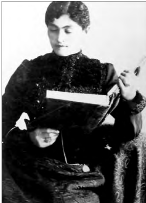
Fig. 2. Señora con libro. Archivo Histórico BCE.

100 pesos de multa. Igualmente en el caso de que una escuela de niñas esté bajo la dirección de un hombre”. 30 Sin embargo, no se puede dejar de señalar que a pesar de que esta medida tuvo una connotación moral, en la práctica favoreció la inserción de las mujeres en el espacio educativo como preceptoras, proceso que se profundizaría en la época liberal. Muchas mujeres descubrieron a partir de ahí el gusto por las bellas artes y los libros, aunque el mismo haya comenzado por textos y lecturas de tipo religioso.