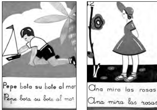
Fig. 18. Semillitas , Libro único para primer grado.