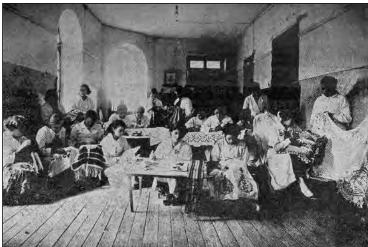
Fig. 39. Actividades manuales. Liceo Municipal Fernández Madrid (1937). 38