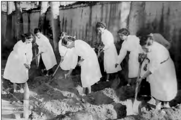
Fig. 8. Prácticas agrícolas. Biblioteca Colegio Manuela Cañizares.

1993:81). Los testimonios de alumnos de estas misiones señalan que los maestros alemanes fueron a veces demasiado rígidos, pero que su rigurosidad y exigencia también fueron aspectos formativos: “ellos nos enseñaron a ser responsables en nuestra profesión: la preparación de la clase, la elaboración del material a usar, la didáctica” Y si bien tuvieron un acercamiento humano con sus estudiantes, también hubo contradicciones. 30 Afirman que la enseñanza se impartía tomando como base la investigación, la observación y el énfasis en materias como la psicología -ciencia indispensable para la pedagogía- el trabajo manual, las ciencias naturales, la música y el canto, la participación conjunta de maestros y alumnos en las horas sociales, la realización de excursiones y paseos a pie al volcán Pichincha y a los alrededores de Quito, las prácticas agrícolas llevadas a cabo al interior de los colegios, entre otros (Fig. 8). La relación con el medio, con el entorno se trataba en la materia denominada “lugar natal”. Un aspecto también desarrollado por las dos misiones fue la educación física, que sería un antecedente para su incorporación a los planes educativos nacionales a partir de los años treinta.