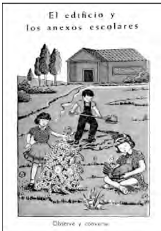
Fig. 19. Caminitos de Luz .

Todas estas láminas muestran una imagen de niña hacendosa, afable, pulcra y también en algunas (minoritarias) como la lámina “Blanquita niña ejemplar” también se incorpora la imagen de la niña estudiosa (Báez y Cevallos s.r.). En una escena de “Nuestro Hogar” el padre lee mientras la madre está cocinando. En “las actividades en el hogar” solamente intervienen la mamá y la niña. Como se observa, había un rol diferente asignado a los niños y niñas en las actividades y tareas hogareñas aspecto que también se veía reflejado en la vida cotidiana. 36