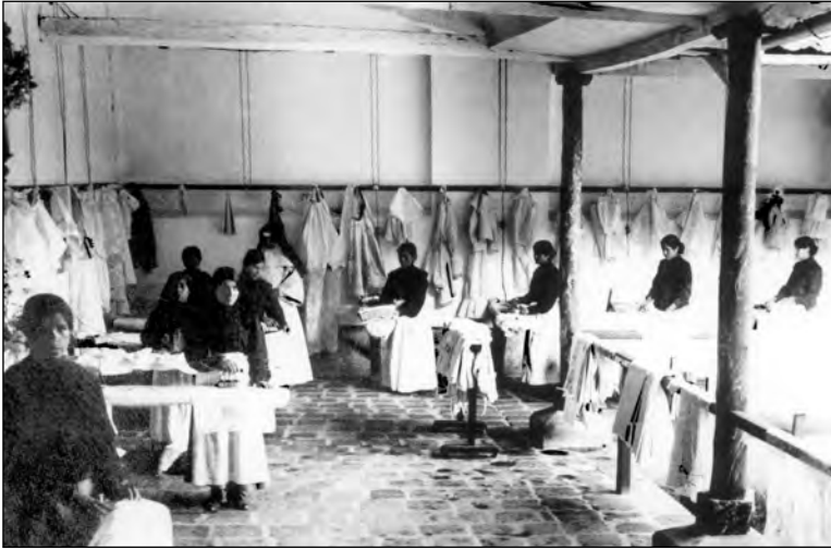
Fig. 1. Lavanderías de El Buen Pastor a inicios del siglo XX.

de la mujer en la sociedad se centraron en las elites y estuvo relacionada con su preparación para formar sus hijos en la vida doméstica. En cuanto a las mujeres de los sectores subalternos, sus roles se definían de modo práctico. Las mujeres indígenas en la ciudad, por ejemplo, formaron parte de la servidumbre doméstica, el comercio y los servicios, y según el Censo de la ciudad de Quito de 1906, su cantidad era importante. 20 Sin embargo, en la discusión oficial no eran tomadas en cuenta, no formaban parte de una preocupación ciudadana, a no ser en relación a las acciones benéficas. Igual se puede afirmar con respecto a las artesanas, trabajadoras de manufacturas y de la incipiente mano de obra fabril. Estaban enmarcadas en relaciones patriarcales, al mismo tiempo que sujetas a servidumbre o a condiciones precarias de trabajo. Este tipo de relaciones se definían de modo práctico en la vida cotidiana, no eran parte de lo público o de las discusiones públicas. Era de manera práctica como los ciudadanos blanco-mestizos establecían distintas formas de clasificación y de trato con las mujeres (y hombres) de los sectores subalternos. Se trataba de saberes incorporados: formas de relacionarse, de “saber mandar”, “educar”, “orientar”, “civilizar” y “cristianizar” en las que los ciudadanos se sentían investidos de autoridad. Hasta inicios del siglo XX estas relaciones esta-