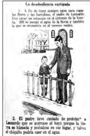
Fig. 15. Curso Elemental de Lectura , Colección Lasalle, Quito, 1964.

Los glotonos se acarrean agudos dolores y graves enfermedades. REFRAN.—La inteligencia es madre de buena ventura: El cuidado y la actividad aumenta la fortuna. VOCABULARIO.—Engullir, tragar la comida precipitadamente sin mascarla. Estómago, órgano del aparato digestivo humano. De seguro, ciertamente, en verdad. En adelante, después, en tiempo venidero. Glotona, que come mucho y con ansia. Golosa, aficionada a comer golosinas.