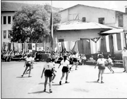
Fig. 32. Jornadas deportivas. Biblioteca Colegio Manuela Cañizares.

realidad, no pasaban... había que dar un examen terminando el tercer curso, para entrar al cuarto había que dar un examen de haber aprobado álgebra y gramática. Y temblábamos, porque ella era de las personas que abría la puerta de la clase -un rito tan singular no, ahora ya no se puede hacer eso- pero ella abría la puerta de la clase y nos tenía ordenado que tengamos la hoja de papel y la pluma listos para el examen de ortografía. No perdía un