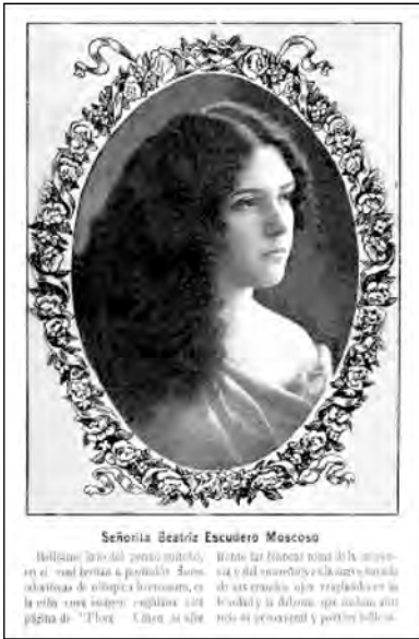
Fig. 45. Revista Flora .