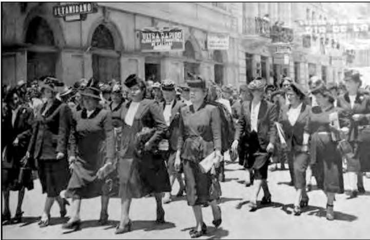
Fig. 28. Desfile.

Hay que señalar también que estas imágenes austeras y nítidas de las maestras fueron parte del ceremonial educativo: de los desfiles en las calles junto a sus educandas (Fig. 28); de los aniversarios patrios en las escuelas; de los actos, veladas y ceremonias donde se pronunciaban discursos, se honraba los símbolos nacionales y se ponían condecoraciones. Ningún espacio secular estaba tan ritualizado como la escuela, pero ese ritual servía, al mismo tiempo, como recurso para la afirmación del maestro y la maestra en el campo educativo, así como de las capas medias en el campo social.