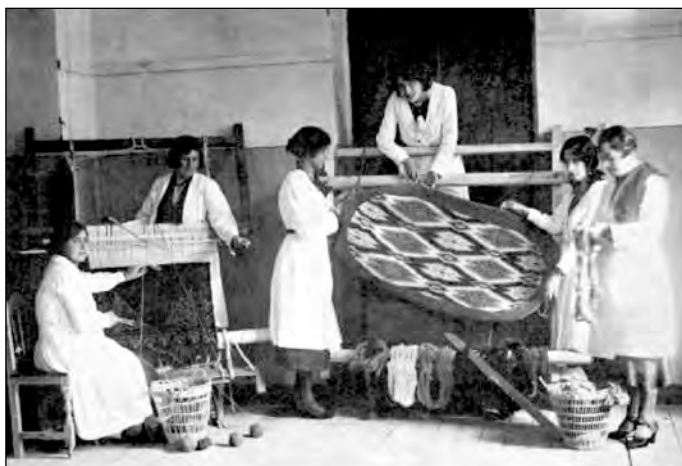
Fig. 37. Actividades Manuales. Bodas de Oro. Fernández Madrid en el Corazón de Quito, 1830-1940.

Escuela, 245 fueron varones y 62 mujeres. La sección femenina comprendía (de igual manera que la masculina) el estudio de algunas materias básicas, conjuntamente con la teoría y práctica del taller. En 1935 se separó la sección femenina y se convirtió en una escuela independiente, bajo el nombre de Escuela Profesional de Señoritas. Se implementaron talleres de corte y confección, labores y bordado a máquina y tejido de alfombras