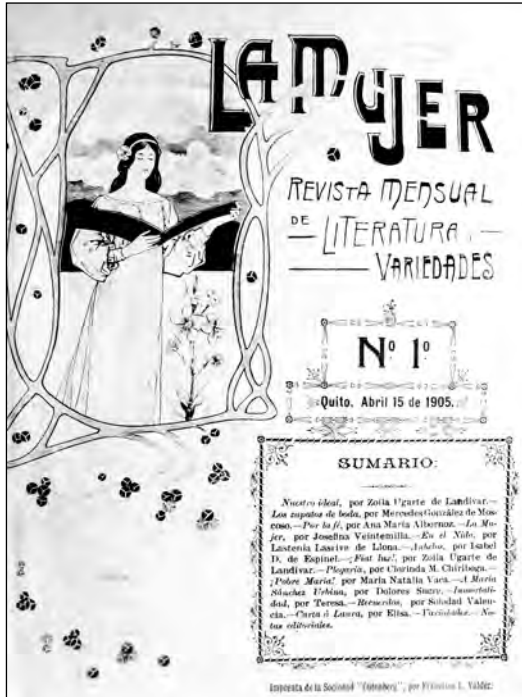
Fig. 47. Portada revista La Mujer , 1905.

para sostenerse sola?" Se trata de mujeres ilustradas que se sienten con el mismo derecho de los hombres para manifestarse de manera pública y dentro de un ámbito público (desde un nosotros) en nombre y representación del conjunto de mujeres. Quieren que la mujer sea colocada en un puesto de igualdad por el perfeccionamiento de sus facultades y por las posibilidades de una independencia económica.