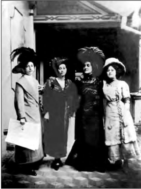
Fig. 6. Miembros del Conservatorio.

del normal Manuela Cañizares (1901) que las maestras fueron adquiriendo legitimación y mayor nivel de profesionalización. También el gobierno liberal abrió cursos especiales para señoritas en el Conservatorio Nacional de Música (Fig. 6) y en la Escuela de Bellas Artes fomentando además, por medio de becas, los estudios de obstetricia y el ingreso a la Facultad de Farmacia.