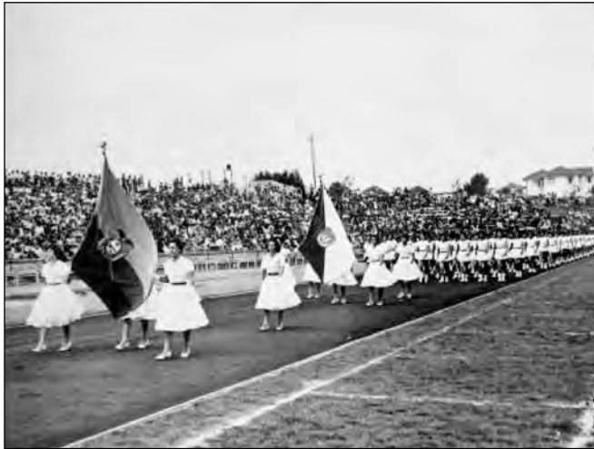
Fig. 30. Desfile escolar. Biblioteca Colegio Manuela Cañizares.

normalista para las obreras que deseaban adquirir o ampliar sus conocimientos. La creación de extensiones para obreras respondía al ideal reformista de esos años 23 . Se trataba de difundir los conocimientos adquiridos, preparando a las obreras para el trabajo moderno y para su responsabilidad como madres. Las materias que recibían eran: normas fundamentales de higiene, economía doméstica, puericultura y mecanografía, así como enseñanzas necesarias para el desempeño en almacenes y otras oficinas o departamentos de comercio. De este modo, las maestras estaban buscando una incorporación ventajosa de mujeres de sectores medios y populares al mundo del trabajo y un manejo racionalizado del hogar.