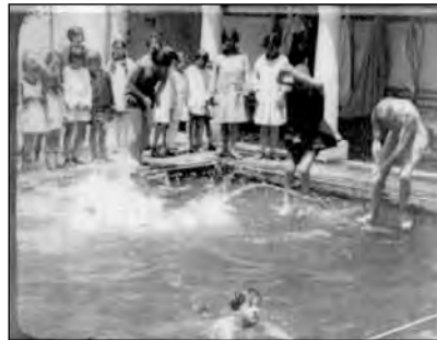
Fig. 34. Actividades escolares en el 24 de Mayo. Fotogramas de Ecuador Noticiero, dirigido por Manuel Ocaña en 1929. Cinemateca Nacional.

Lo que buscaban las estudiantes al ingresar a ese colegio estaba relacionado tanto con el prestigio social como con el acceso a una educación calificada como recurso para desenvolverse en la vida moderna. En otros casos, lo que atraía del colegio era una formación más abierta para las niñas, incluso si las familias seguían siendo cristianas. Esta condición del colegio, como espacio propiamente educativo en las relaciones entre maestras y estudiantes que comenzaba a medirse en términos culturales antes que de status social, constituyó la base para su posterior democratización (Uzcátegui 1981:171)