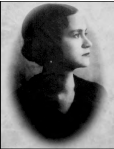
Fig. 51. Matilde Hidalgo de Procel.

para gozar del derecho de dar su voto en las elecciones, consulta originada en el caso concreto de que una señora se había inscrito en los catastros electorales, ha hecho que el H. Consejo de Estado afirme y defina la jurisprudencia en tan importante materia. Según la citada corporación, son ciudadanos las mujeres al igual que los hombres pues la Constitución no distingue de sexos cuando determina las condiciones de la ciudadanía –tener veintiún años de edad y saber leer y escribir– y el ejercicio del derecho del sufragio no requiere otro requisito que el hallarse los individuos en pleno goce de dicha ciudadanía. 44