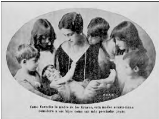
Fig. 11. AHM, Fotografía en Carlos Sánchez, Breves nociones de Puericultura , Imprenta de la Universidad Central, 1928.

Se recalcó que no era un concurso de “niños gordos”, sino de “madres cuidadas”. Se decía que se trataba de evitar y prevenir la mortalidad infantil creando la “Casa de la Madre” para los sectores populares. 15 Las políticas de protección a la infancia no fueron ajenas a las condiciones concretas del país, a la crisis económica existente y al alto índice de mortalidad pero eran resultado, sobre todo, de un nuevo horizonte mental que asignaba al estado el cuidado de las poblaciones y convertía a las familias y a las madres en agentes intermediarios de las acciones estatales. Además, las familias empezaban a estar vinculadas a la escuela y a los centros de salud y protección infantil. Es cierto que eso obedecía a una situación real en esos años pues los índices de mortalidad infantil hasta los 10 años oscilaban alrededor del 40%, lo cual significaba que la mitad de las defunciones correspondía a niños menores de esa edad pero, al mismo tiempo, se había desarrollado una nueva visión estatal que cambió la percepción sobre las mujeres y las políticas con respecto a ellas. Es posible que en épocas anteriores hayan existido condiciones de mortalidad y salubridad semejantes o aún peores, pero hasta este momento no habían sido visibilizadas o puestas de relieve por las investigaciones de los higienistas, médicos y maestros, ni por los sistemas asistenciales estatales.