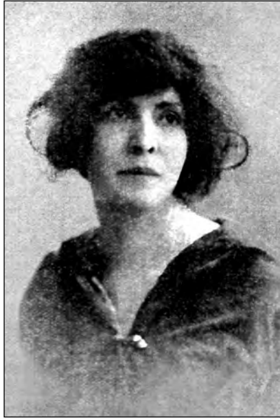
Fig. 7. Zoila Ugarte de Landívar

También fue directora de la Biblioteca Nacional y maestra del normal Manuela Cañizares y de los liceos Fernández Madrid y Simón Bolívar. En 1905 ella planteó que las mujeres debían ser colocadas en un puesto de igualdad por el perfeccionamiento de sus facultades. Como liberal utilizó la imagen de la luz para defender este derecho: