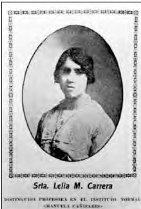
Fig. 26. Revista El Magisterio Ecuatoriano . Quito.

Uno de los aspectos importantes de la labor de los normales fue la generación de un modelo de mujer y maestra distinto a los anteriores. Esto se expresaba en la formación de modelos o referentes y que se ponía en evidencia no solo en aspectos formativos y dispositivos morales, sino en una gestualidad y en una postura física.