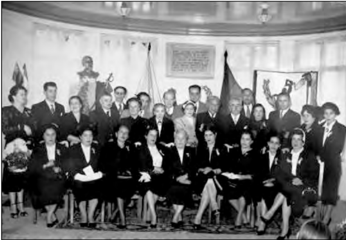
Fig. 31. Profesores y profesoras. Biblioteca Colegio Manuela Cañizares.