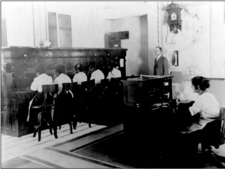
Fig. 5. Telefonistas, 1916.

ca (Fig. 5). Esto no quiere decir que los antiguos roles de las mujeres como madres y esposas desaparecieran, pero hubo el intento de que se secularizaran en función de la ideología liberal del progreso y de las nuevas formas de control del cuerpo social y de los individuos.