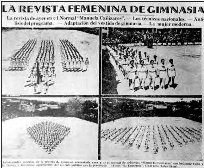
Fig. 12. El Comercio , 13 de junio de 1937.

confianza en sí, nace el optimismo, que es el cimiento de la felicidad”. También planteó que “la educación física despierta y ejercita la capacidad de observación y acrecienta el valor. Un buen gimnasta se halla capacitado para resoluciones prontas y actuaciones precisas y es resistente a las fatigas y a los sufrimientos morales. Por medio del ejercicio se conquista la salud, a la vez que con el vigor físico se tonifica el espíritu”. Habría que preguntarse cómo estos planteamientos fueron procesados internamente, por ejemplo, si las excursiones escolares, que eran parte del mismo programa educativo ¿no ayudaban a la formación de individuos activos útiles para la vida moderna y, al mismo tiempo, enriquecidos con el contacto de la naturaleza y el medio ambiente? Como se verá más adelante, las maestras buscaron en sus estudiantes el desarrollo de comportamientos distintos a los que tradicionalmente habían tenido las mujeres, modificar sus actitudes corporales y construir un tipo de mujer activa y afirmativa tanto en términos sociales como de género.