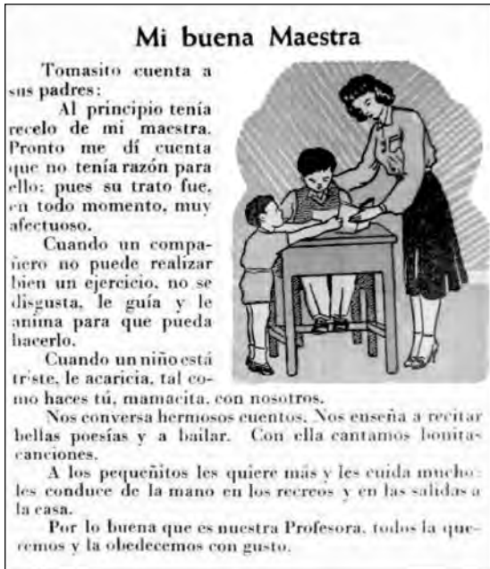
Fig. 42. Texto escolar Caminitos de Luz .

dar que no solo los niños sino las maestras leyeron continuamente esos textos).