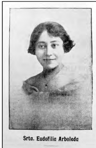
Fig. 22. Revista Magisterio Ecuatoriano . Quito.

futuras educadoras. Debo si, confesar, que puedo haberme equivocado al querer implantar este sistema de disciplina, pero juzgué llegada la hora de desterrar la disciplina nacida del miedo y permanezco fiel a mi criterio del verdadero concepto de disciplina” (Arboleda 1932 cita Herdoíza 1951: 276). Retomando a Norbert Elías (1995) se puede hablar de cambios en las estructuras de sensibilidad desde adentro, en lugar de hacerlo a partir de coacciones externas. Uno y otro tipo de acción disciplinaria no eran en todo caso externas. Para desarrollar actitudes y comportamientos como los señalados, las maestras debían tener una vigilancia constante pero también una auto vigilancia. Esto estaba relacionado con la acción pedagógica pero también con la necesidad de “manejar las impresiones” y generar una nueva imagen de sí mismas.