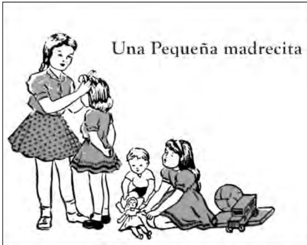
Fig. 43. Texto escolar Caminitos de Luz .

Mis papás no querían que yo sea profesora, pero yo me hice profesora por vocación, porque me gustaba, desde niña mis juegos fueron sobre la escuela y yo era la maestra... 4