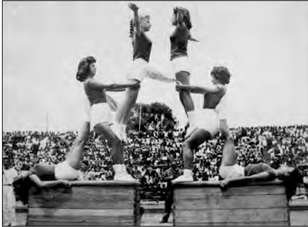
Fig. 24. Revista de Gimnasia. Biblioteca Colegio Manuela Cañizares.

mujer) debían estar dirigidos primordialmente a “hacer una mujer sana, vigorosa y armoniosa, es decir una mujer que sepa sentir la necesidad del ejercicio físico, para que así alcance a sus hijos una vida sana y feliz”. 17