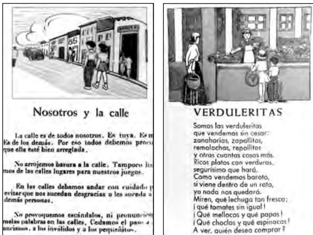
Fig. 16. Caminitos de Luz , Libro de Lectura de segundo grado.

Si se comparan estas imágenes con las del libro Jilgueritos se observa que el niño lejos de ser forzado a adquirir hábitos higiénicos y a ser avergonzado por los profesores, los asume autónomamente. En ese mismo texto escolar se discute, por ejemplo, la relación entre los niños y la calle. “La calle es de todos nosotros y por eso debemos cuidarla”. En realidad el problema fue más allá de los textos utilizados y se conectaba con lo que se podría denominar un habitus pedagógico. Me refiero a la relación vertical entre maestro y estudiantes, la supremacía del libro y de la escritura, el aprendizaje memorista y el sistema de premios y castigos. Todo esto estaba (y en parte está) incorporado al sentido práctico de los maestros y no podía ser transformado de la noche a la mañana. La educación activa, como escuela pedagógica intentaba, sobre todo, la generación de dispositivos educativos que cambiaran esas prácticas y esa era la función de los textos escolares.