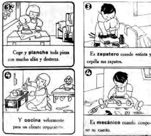
Fig. 17. Semillitas, Libro único para primer grado.

En los “Oficios de Ovidio” en cambio: “Es sastre cuando pega un botón. Es carpintero si pone clavos en una tabla y hace un ropero. Es zapatero cuando entinta y cepilla sus zapatos. Es mecánico cuando compone su carrito. Es herrero cuando endereza un clavo. Es agricultor cuando riega las plantas de la huerta”. Se valorizan las actividades manuales artesanales y agrícolas, como parte del proceso de formación de una cultura nacional democrática, pero de ello no participan las niñas. Las actitudes de las niñas, con excepción de las tareas domésticas, son en su mayoría pasivas: mientras “Ana mira las rosas”, “Pepe salta la llama”, “Pepe bota su bote al mar” (Fig. 18).