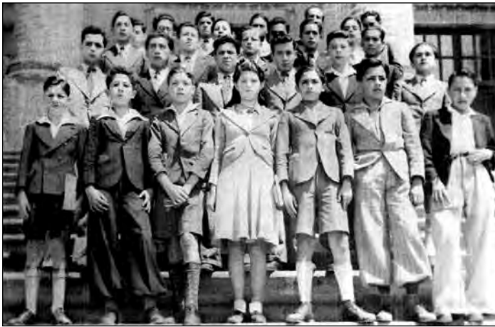
Fig. 9. La estudiante del colegio Mejía.

tema tenía muchas ventajas ya que estaba en perfecta armonía con lo que sucedía en todos los momentos de la vida social contemporánea, donde “se considera a hombres y mujeres como trabajadores de valor idéntico en la sociedad humana, llamados a laborar juntos, a ayudarse mutuamente en la lucha común y marchar unidos por los derroteros que conducen al progreso y armonía social”. Bravo cree que se debe mantener en la escuela, como en la vida, juntos a niños y niñas. El ejemplo paradigmático sería Estados Unidos “el país clásico de la coeducación donde se ha experimentado desde hace un siglo la escuela coeducacional con magníficos e innegables resultados”.