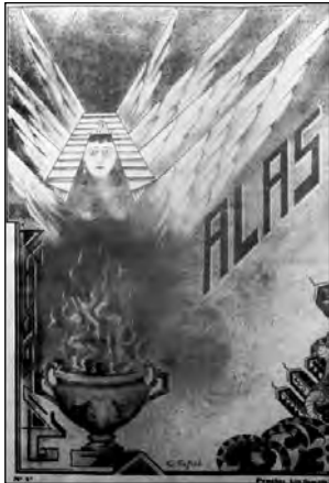
Fig. 49. Portada de la revista Alas , 1934.