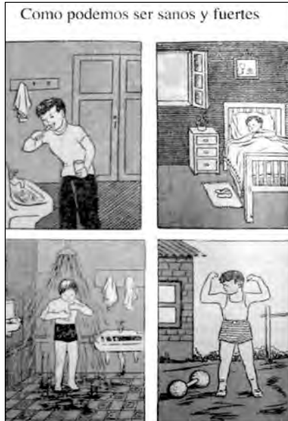
Fig. 13. Caminitos de Luz , Libro de lectura de segundo grado.

tante fue la introducción de dispositivos administrativos (registro de profesores, escalafón y ficha de los profesores, informes impresos de labores) de medición del rendimiento, conducta y condiciones de los niños, así como de sus condiciones de salud.