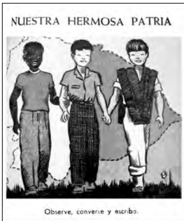
Fig. 20. Caminitos de Luz , libro de lectura de segundo grado.

(1951:136) señalaba como un punto a favor de la educación de los normales el dar un carácter nacional a la educación y haber “extendido la cultura fundamental” a todos los rincones del país, aún de los parajes selváticos, dando en todo momento y a todos los grupos humanos la sensación de Patria, “una y grande” de hecho estaba proponiendo un proyecto de homogenización cultural. Pero no hay que perder de vista que lo hizo en el contexto de una sociedad que continuaba siendo de castas y privilegios estamentales, aunque había entrado a modernizarse. La incorporación de nuevos sectores sociales a la idea de nación podía contribuir a cambiar esas condiciones (Fig. 20). Cuando señalaba que el proyecto educativo nacional que ellos defendían dio “preferencia a la historia y la geografía nacionales, poniendo al Ecuador como epicentro del mundo y como término de comparación y de relación con otros países, pues era necesario dar a conocer a los ecuatorianos quienes somos y en que medio geográfico vivimos con la obligación de hacer Patria”, planteaba que era en oposición al “desconocimiento de nuestros valores nacionales y el complejo de inferioridad que caracteriza a la generalidad de personas de nuestras elites sociales” (Torres 1951: 111).