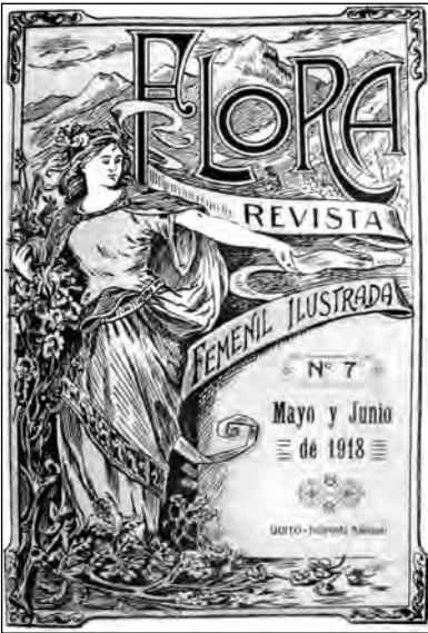
Fig. 48. Portada revista Flora .

pequeña empresa editorial que intenta financiarse con suscripciones, crónica social y pequeñas ayudas presupuestarias estatales pero que también abre un espacio a las mujeres con inquietudes intelectuales. “Para ser dignas del nuevo rol, para administrar el bien y para que no le sea perjudicial el goce de su independencia, necesita ampliar, modificar, apropiarse de nuevos y mejores conocimientos: pero sobre la base de la virtud, con el auxilio de las santas creencias, sin salir de su propio y natural terreno” (Galarza 1917:1). La directora de la revista llega a decir: