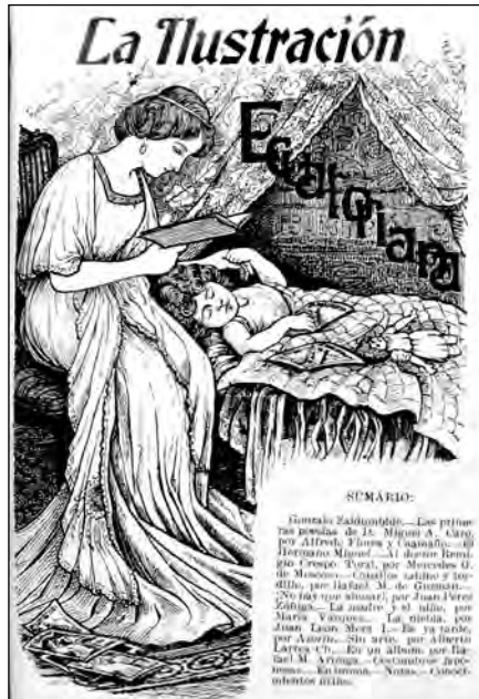
Fig. 4. Revista La Ilustración Ecuatoriana No.19, Quito, 1910.

sectores sociales altos, fueron muy exigentes en su uso. 40 En los programas de enseñanza de estos colegios, se lo estudiaba en la materia urbanidad una hora por semana durante todos los años. 41