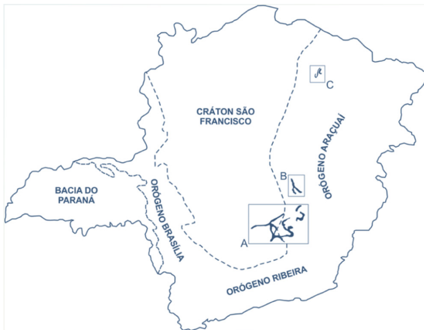
Figura 2. Esquema com as principais províncias portadoras de minério de ferro de Minas Gerais