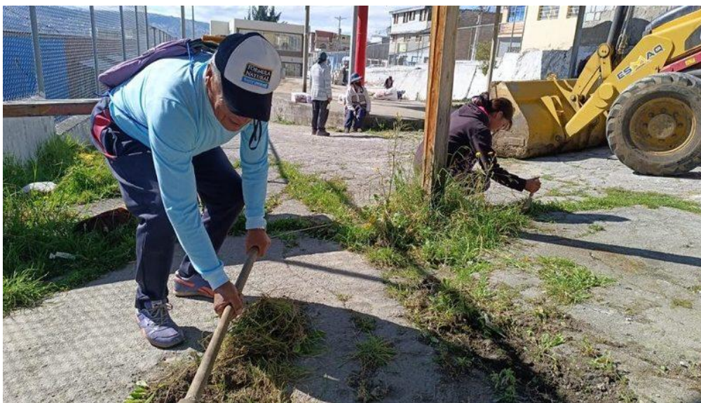
Foto 2.1. Minga en la casa comunal de la comuna Marcopamba La Raya

puede ser por los avances en el mundo de la economía, la producción, la cultura, la política o por el desarrollo del conocimiento y el surgimiento de nuevos paradigmas de interpretación. Estos procesos van a incidir en la significación de los contenidos conceptuales que se van construyendo socialmente (Llanos Hernández 2020, 208).