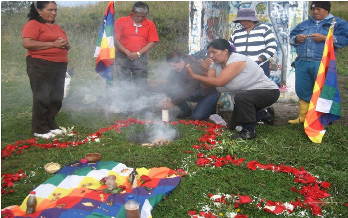
Foto 2.4. Ritual amarre de las cruces en el cerro Ungüí