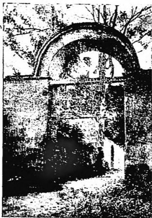
Portada principal de "La Quinta" solar de la familia Andrade.