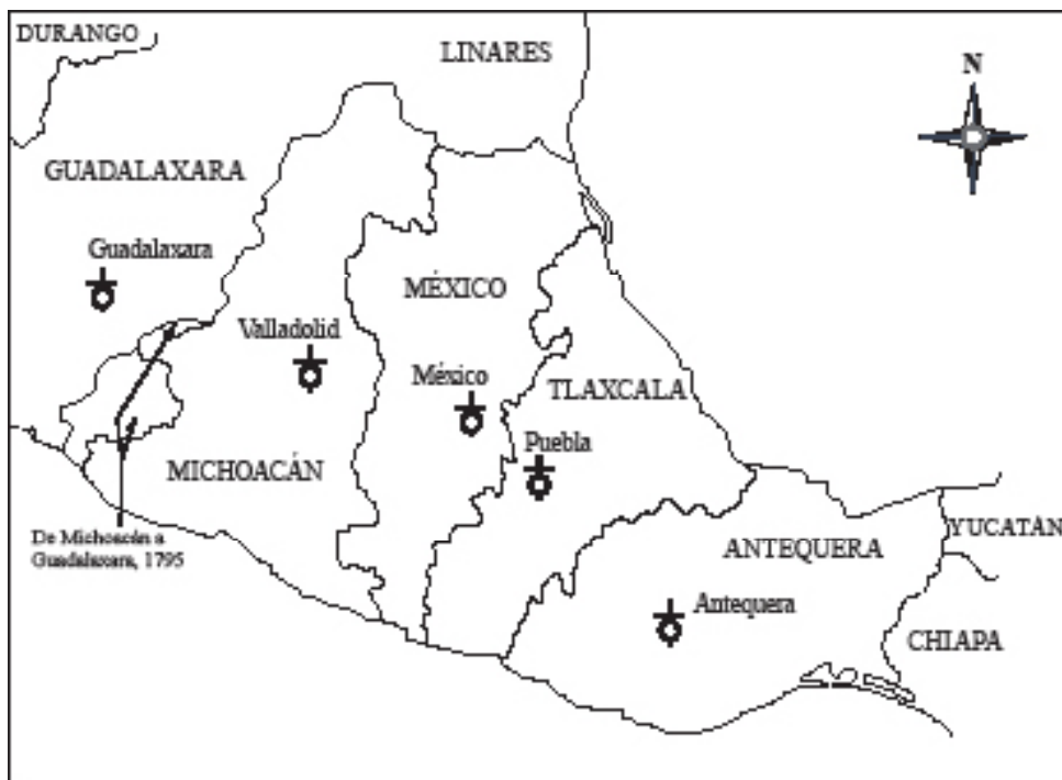
Mapa 1. Los obispados de Nueva España

Así, el objetivo general del presente capítulo –que recoge algunas aproximaciones previas de mi autoría (Aguirre, 2014a y 2015a)– es reflexionar hasta qué punto el arzobispo Lorenzana cumplió o no, y por qué, con la reforma ordenada por Carlos III en lo referente a los principales problemas históricos que aquejaban al régimen parroquial, a saber: la secularización de doctrinas, abusos en los derechos parroquiales, la división de parroquias muy grandes, falta de tenientes de cura y el no reparto del diezmo a las parroquias.