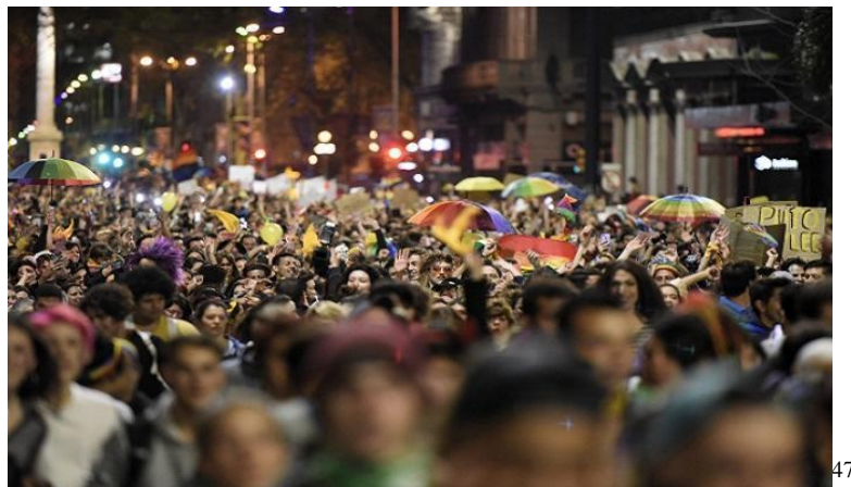
Imagen N° 1 Los espacios públicos hoy

estaría sobre el plano de preocupaciones gubernamentales la mancomunación entre la órbita pública y la privada para promover proyectos inclusivos con miras identitarias.