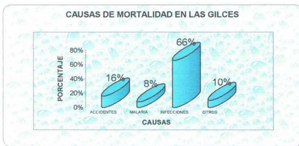
GRÁFICO 2.4. : CAUSAS DE MORTALIDAD

Entre las patologías más frecuentes podemos mencionar: enfermedades infecciosas intestinales; enfermedades parasitarias; enfermedades respiratorias; dengue y paludismo; traumatismos; enfermedades de la piel; enfermedades virales: varicela, rubéola, exantema súbito; enfermedades genitourinarias y venéreas; enfermedades congénitas como ceguera, parálisis cerebral, síndrome Dawn, oligofrenias. Enfermedades degenerativas y malignas: aterosclerosis, reumatismo, tumores, cáncer. Enfermedades psicológicas: ansiedad, depresión, neurosis, psicosis, alcoholismo.