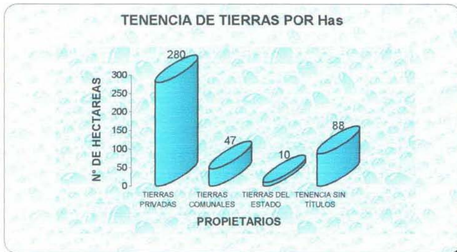
GRÁFICO 2.5. : TENENCIA DE TIERRAS