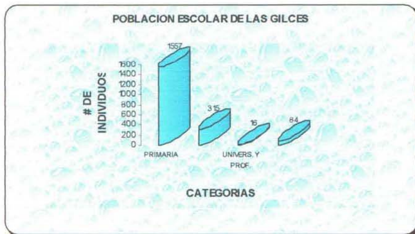
GRÁFICO 2.3. : POBLACIÓN ESCOLAR

Las viviendas inadecuadas, reducidas, generalmente de cana, estan rodeadas y comparten el espacio con animales domesticos como chanchos y aves y este nacimiento faciilita el contagio de enfermedades de la piel, nicóticas, dermatitis, la tungiasis afección conocida vulgarmente como nigua; enfermedades respiratorias como faringo- amigdalitis, bronquitis, conjuntivitis.