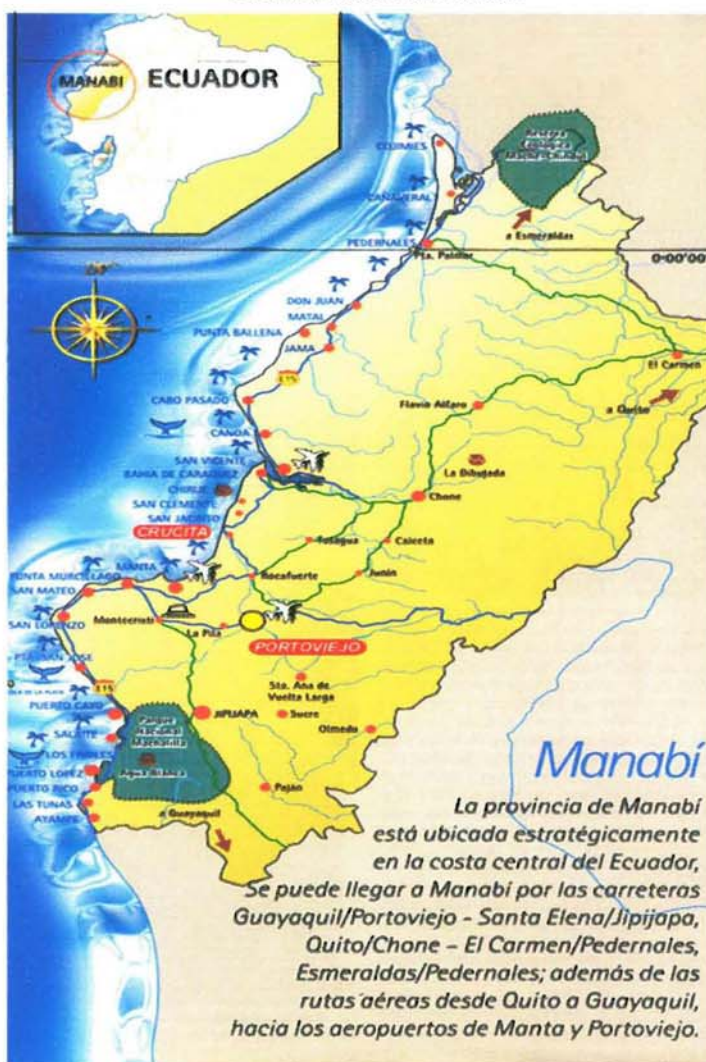
FIGURA 1.1. : MANABI

La comuna Las Gilces, se encuentra localizada en la parroquia Crucita al noroccidente del cantón Portoviejo, provincia de Manabí; República del Ecuador. Geográficamente se encuentra ubicada a 0° 57' Latitud Sur y 80° 32' Longitud Oeste, con una totalidad 4 de 447,29Has. Limita al Norte con San Jacinto, al Sur con los Ranchos, al Este con los Tamarindos – Elvira y al Oeste con el Océano Pacífico.