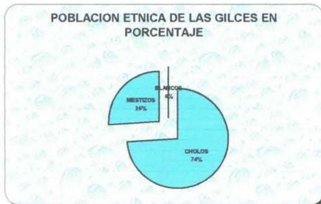
GRÁFICO 1.1. : ETNICIDAD DE LA POBLACIÓN DEE LAS GILCES