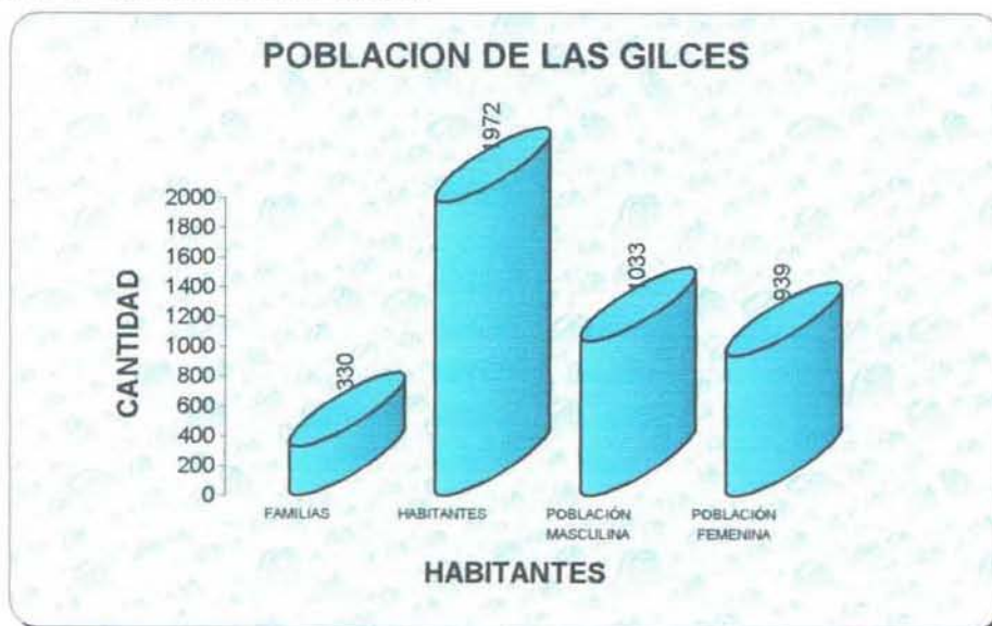
GRAFICO 2.1. : POBLACIÓN DE LAS GILCES

La población comunal de Las Gilces mantiene una importante relación con la Unión de Organizaciones Comunitarias Rurales, que le permite vincularse con las diferentes comunas de la Parroquia, con el cantón y la Provincia.