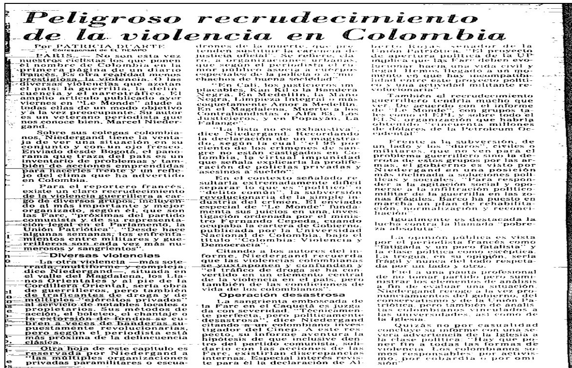
Figura 18. A propósito del informe del periodista Niedergand sobre la situación en Colombia

Los mismos comisionados de la experiencia, al realizar un balance de ella, poco tiempo después de terminada, son también claros al considerar que el significado y potencialidad de esta radiografía radica precisamente en que que asume que en el país, “ las múltiples violencias se están retroalimentando y superponiendo, al punto de una anarquización generalizada de la vida social y política del país ” 304 . No faltan de todas formas, las voces que consideren que es una “radiografía inútil y costosa” porque termina diciendo “lo que ya todos sabían”. 305 De otra parte, en el periodismo internacional el “informe radiográfico” será bien recepcionado, por ejemplo, por el periodista Marcel Niedergand, que apoyado en este trabajo publica en el periódico francés Le Monde , un extenso artículo sobre la situación colombiana, donde destaca las diversas violencias y las múltiples organizaciones paramilitares y escuadrones de la muerte que ejercen el crimen organizado en las principales ciudades 306 .