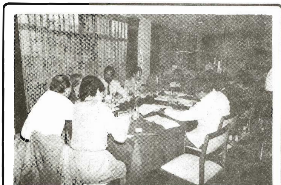
Mesa de trabajo de la Reunión de Expertos para el funcionamiento de la Red Andina de Información sobre las Artes Populares, realizado en Quito, los días 18, 19 y 20 de diciembre de 1989.