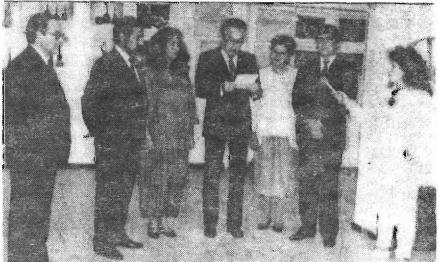
El Señor Embajador de Venezuela Luis Rodríguez Malaspina, inaugura la exposición fotográfica de Instrumentos Musicales de América Latina y el Caribe: realizada en el Centro de Artes del Instituto Andino de Artes Populares.