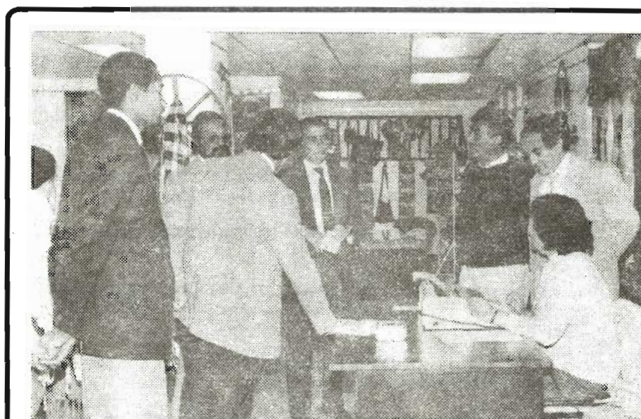
Reunión de trabajo del Jurado Calificador del Tercer Concurso Exposición de Máscaras, realizado en el Taller de Arte y Artesanías del Instituto Andino de Artes Populares del Convenio Andrés Bello – IADAP.