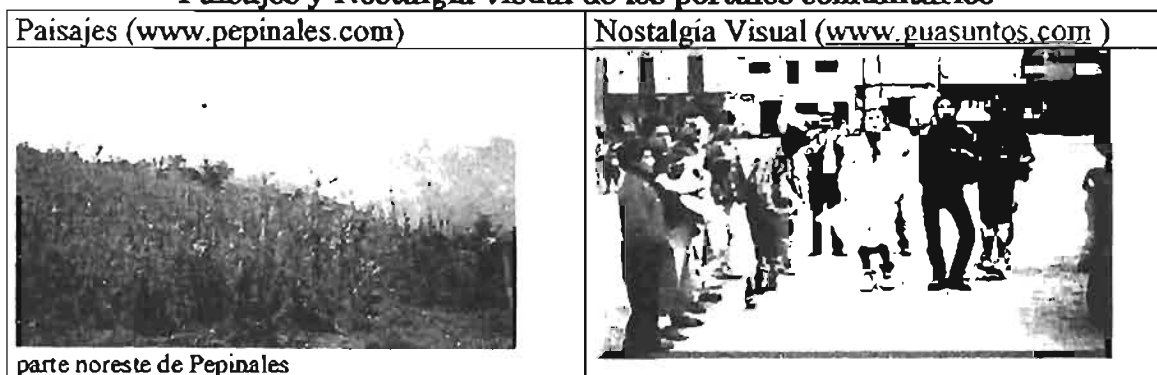
Gráfico No.V Paisajes y Nostalgia visual de los portales comunitarios

Por otro lado, parte de la historia que se narra en las plataformas se dedica a describir sobre los patronos de las comunidades, motivo por el cual los dos portales tienen espacios especiales para sus santos: San Alfonso María de Liborio patrono de Pepinales y San Luis Rey de Francia, patrono de Guasuntos. Y ligado a esto se presenta de manera gráfica fotos de las principales fiestas, así como de los paisajes comunitarios uno de los cuales lleva como título “nostalgia visual”.