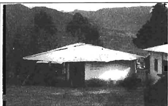
Gallera San Alfonso construida en 1998