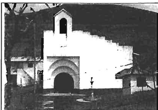
Iglesia de Pepinales construida en 1998