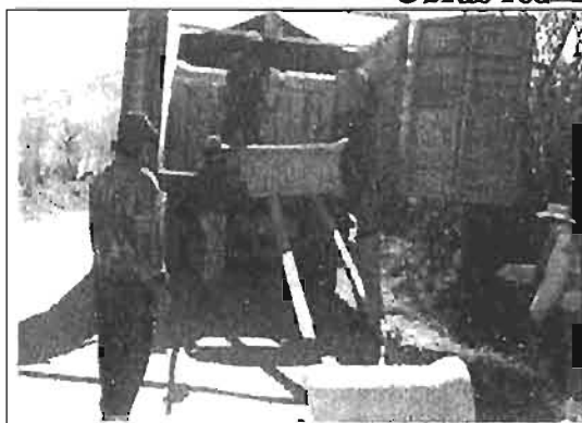
Desembarque del material para el canal de riego