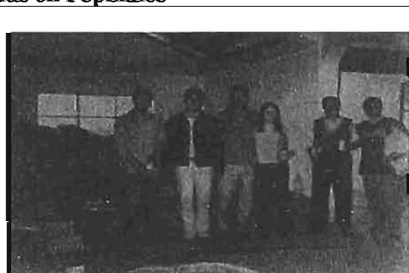
Llegada de la baldosa para el piso del Salón multiuso