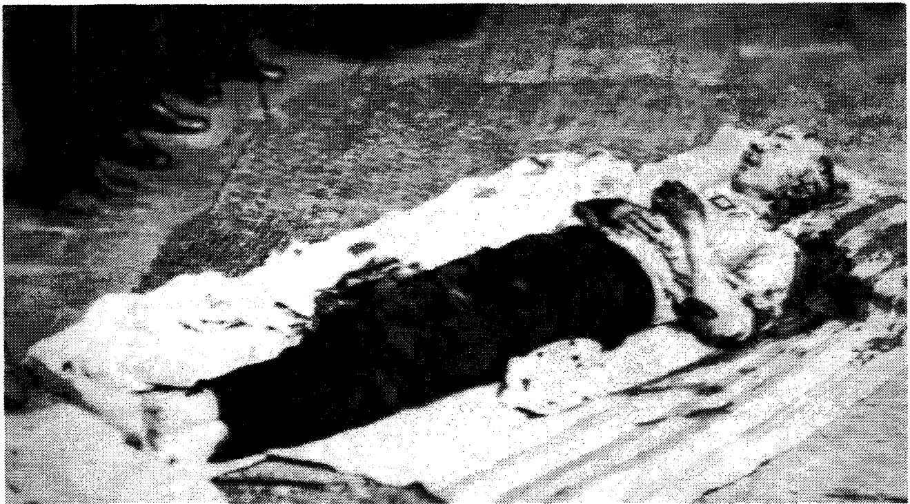
Fotografía del cadáver del presidente García Moreno captada por Rafael Pérez

1875 y a quien el mismo Pérez retratará para sus tarjetas personales de visita y en otras ocasiones tanto en Guayaquil, como en Quito). Las mismas fotos que Pérez tomó para las postales del presidente fueron utilizadas para la ceremonia de procesión de su funeral.