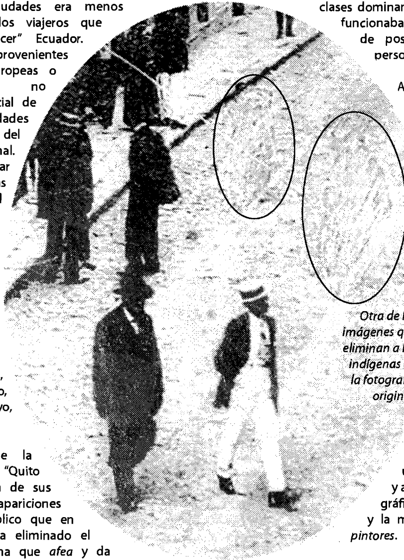
Otra de las imágenes que eliminan a los indígenas de la fotografía original.

La mayor parte de estas tarjetas llevaban el nombre del fotógrafo que las imprimió o de su estudio (en algunos casos en anverso y reverso). Este uso de la fotografía tuvo como fin principal el envío de recuerdos de las clases dominantes, y en algunos casos funcionaban como una especie de postales o breves cartas personales.