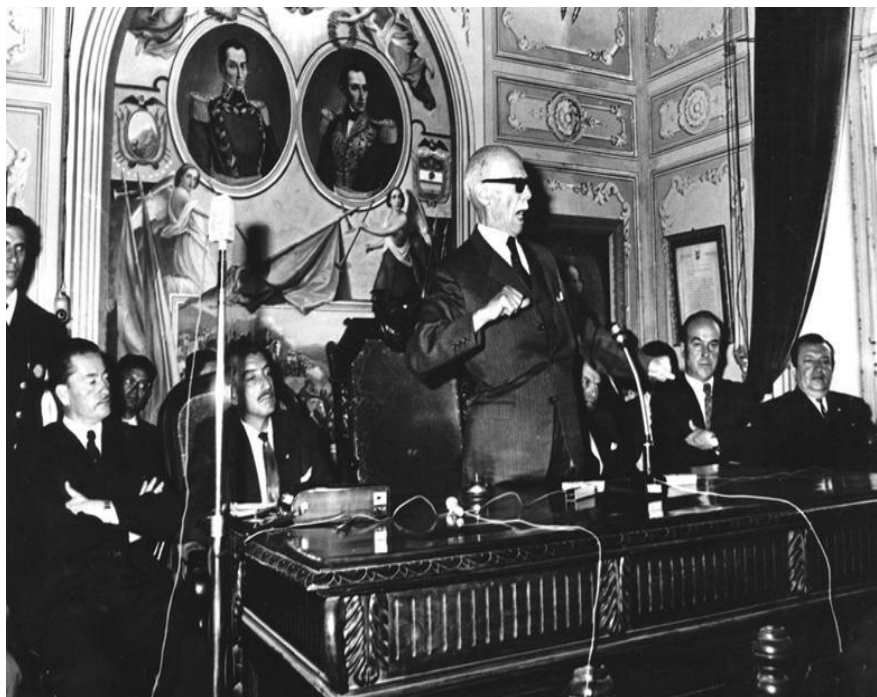
José María Velasco Ibarra en un discurso político en la presidencia de la república 1960

En el Ecuador, hay una importante tradición de liberalismo católico 33 , que se desarrolló a fines del Siglo XIX, la revolución liberal y su virulencia así como la respuesta del clero y el latifundismo tradicional impidieron su continuidad. Velasco Ibarra retomó esa postura como un esfuerzo por superar el debate Laico-liberal y crear una síntesis entre el liberalismo y la prédica cristiana. Así dice Velasco en los párrafos finales de una de sus obras claves. “Los liberales auténticos no solamente deben ser cristianos, sino que el anticlericalismo liberal que se dio en el Ecuador es una desviación” (Ayala, 1996:52).