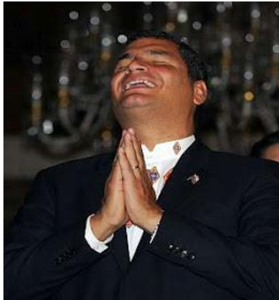
Rafael Correa en el festejo de su reelección 2009