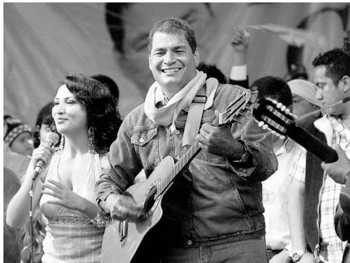
Rafael Correa, en la campaña para la elección del 2006

La pretensión del populismo con estas maniobras, es establecer una relación estrecha con aquellos a los cuales interpela, sirviéndose de los sentires religiosos presentes en el imaginario popular. Pero también le ha valido para anular las contradicciones más fuertes producidas en la lucha de clases y transformarse en una “válvula” de escape de las tensiones sociales, lo cual sigue beneficiando a los grupos de poder en desmedro de los más pobres. De esta manera, a pesar de que los códigos que utiliza el caudillo populista, provienen de los estratos populares, el uso que este y su maquinaria publicitaria dan a estas representaciones convierte a estos símbolos en guiones perfectamente estructurados, para la eficacia de la propagación de su discurso.