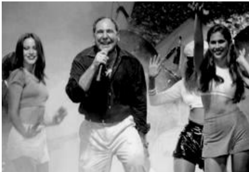
Abdalá Bucaram bailando el Rock de la cárcel 1996

Sin embargo construye su imagen desde las reivindicaciones que surgen de las injusticias, en sus spots publicitarios se muestra como una suerte de mártir, una parodia de Cristo y un salvador de los pobres, pretende consolidar su retórica visual y discursiva de Cristo de los pobres capaz de “entender toda la magnitud, del sacrificio y del arrepentimiento humano. Sus mensajes emplean un lenguaje emotivo, chabacano y popular; apela al amor con frases mesiánicas y religiosas- sea como una lucha entre el diablo e hijos de Cristo; Diosito es roldocista y al subir el petróleo ayudó a este gobierno a pagar la deuda externa”, con un mensaje sencillo, poco complicado, algunas veces en tono amenazante, con cierto corte moralista y transgresor” (Freidenberg, 2008:224). 41