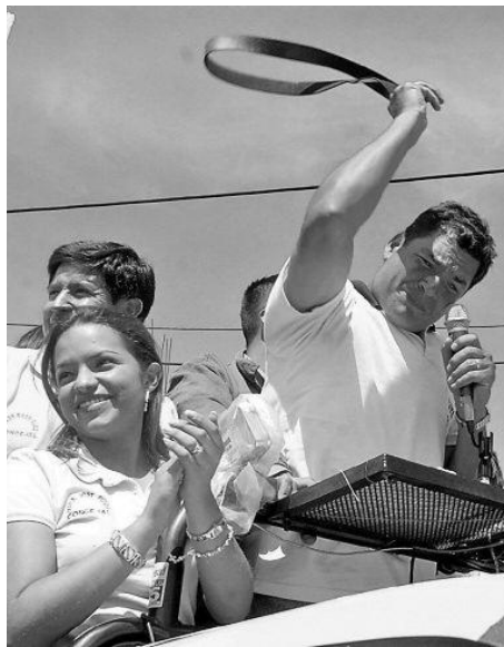
Campaña de Rafael Correa 2006, “Correa y el Correazo.” Si no estás con Correa... Se te caen los pantalones”

Esta manera popular de llamar a sus adversarios, es el reflejo de la búsqueda constante por la identificación popular. En algunos momentos estos lenguajes y símbolos populares son capitalizados por la maquinaria propagandística de las élites “simulando” ser parte del pueblo y para ello utilizan estrategias de marketing político. Desde esta perspectiva podemos observar, que el populismo es incapaz de generar una verdadera voz al pueblo.