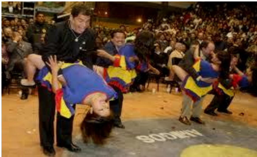
Rafael Correa en un festival con las cheer leader 2010.

Para este autor el discurso “condensa” la realidad, sintetiza y modifica a la vez el entorno social, por medio de una operación de interpelación/constitución de los oyentes (que quedan identificados con una personalidad colectiva). Constituyendo a sus oyentes en una bipolaridad “pueblo” frente a “bloque de poder que se hallan en el momento de la “lucha por la democracia” como una fase específica de la lucha social o de clases (Álvarez junco, 1987: 21).