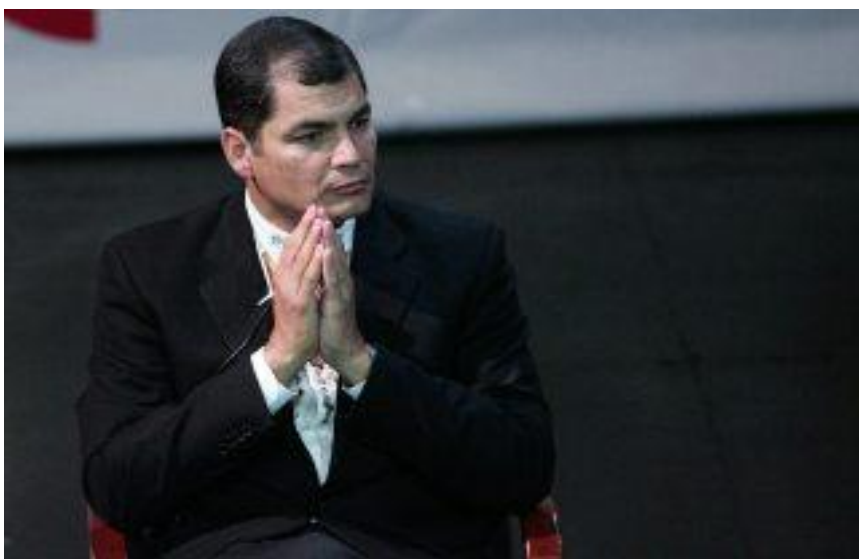
Rafael Correa en un acto público 2010

Observamos como su discurso hace hincapié en dos aspectos importantes. En la primera parte Correa se equipara como padre santo y apóstol de los pobres, mientras que en un segundo momento su discurso reivindica la lucha social. Sus palabras, como las de Velasco hacen percibir una ambigüedad ideológica presente en los populismos. En el mismo discurso citado, también dice: “En el plano personal, mis principios sociales y económicos se fundamentan en la Doctrina Social de la Iglesia Católica, en la Teología de la Liberación, y el Socialismo del siglo XXI que estamos construyendo en América Latina (Min. Política, 2009: 7).