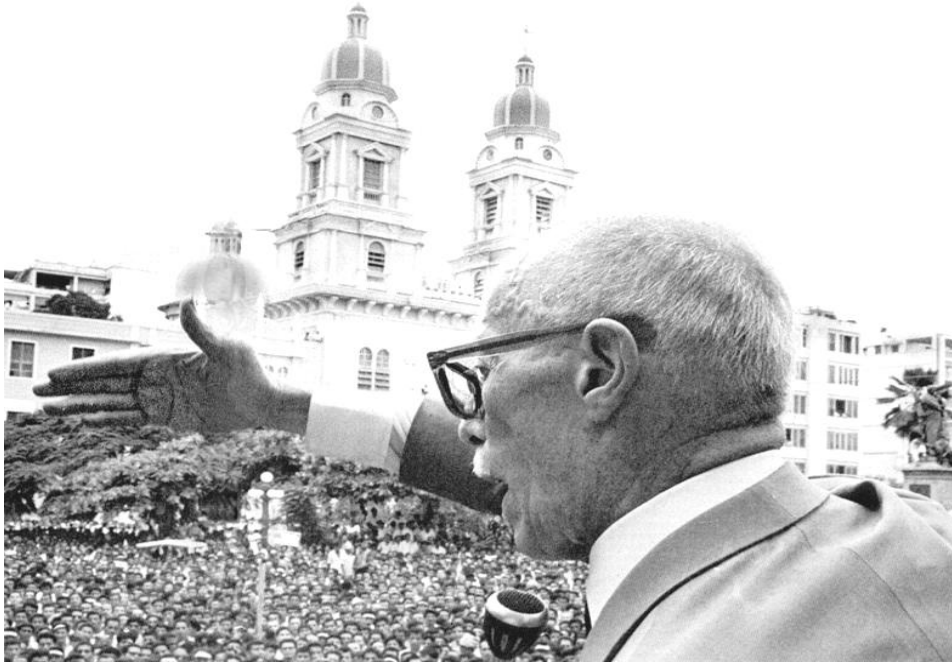
José María Velasco Ibarra en un mitin político 1960

Sin embargo pese al sentido moralizante y religioso de Velasco Ibarra, este apela a la separación entre el Estado y la Iglesia, Existe permanentemente tensiones entre el Líder y la Iglesia sin llegar a ser frontalmente opositor a ella. 31 Velasco se apoya en las creencias de los ciudadanos, en los siglos de cristianización, de imposición, pero también de negociación simbólica con las clases populares, parece entender claramente que el juego del ascenso al poder no requiere solamente del uso de la retórica, de un discurso moral o profundamente religioso, apela al imaginario de quién lo escucha.