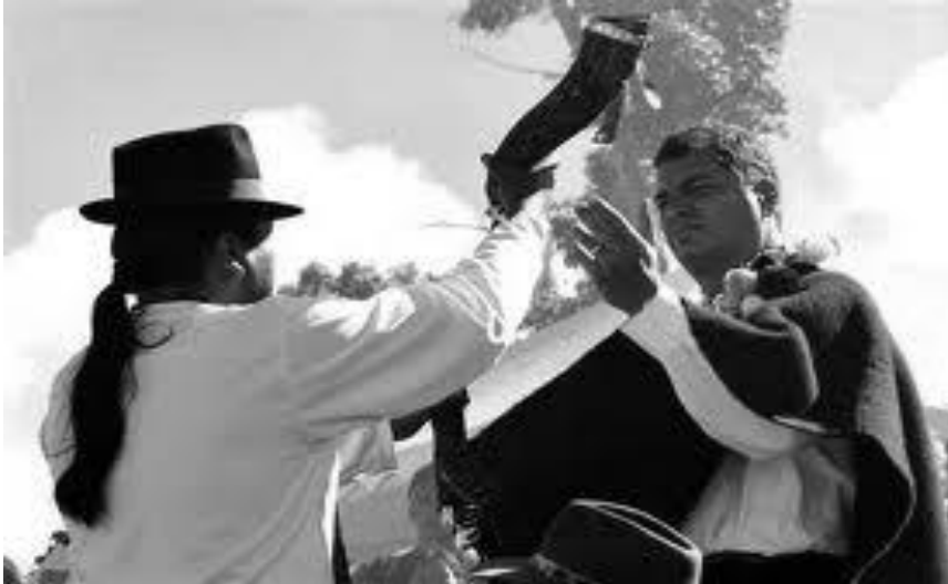
Sumbagua, la entrega del bastón de mando a Correa por parte del Movimiento indígena.

La idea de compartir la pobreza con la gente, de purificarse moralmente en la realidad y el infortunio, Es un elemento clave de su pensamiento religioso, marcado además por el protestantismo norteamericano en el cual se educó. El esfuerzo, la constancia y el sacrificio, marcan también su personalidad como hombre moral. La relación entre lo personal y lo político se traduce en una lucha entre el bien y el mal. “el impacto de un mensaje de este tipo es, sin duda, muy alto. No se trata ya de un mártir cualquiera, sino del Redentor, del Cordero sacrificado por la salvación del pueblo. La transposición política de la imagen religiosa de mayor éxito en la historia de Occidente”. (Álvarez Junco, 1990: 257). La aceptación del sacrificio le proporciona una legitimidad tan fuerte que, en definitiva y aquí está lo contradictorio y extraordinario de la argumentación, le lleva a reclamar el poder. Entiéndase bien: no a postularlo como un político más, sino a fulminar a quienes no reconozcan su derecho a ejercerlo (Álvarez Junco, 1990:258).