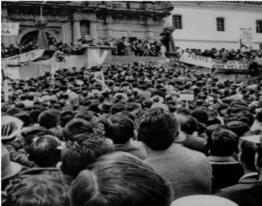
Concentración Populista velasquista en San Francisco

El discurso populista de este líder utiliza como vehículo de propagación el ritual y la tarima, manejando una serie de códigos pensados para las multitudes aprehendidos por el líder e instrumentalizados a través de su discurso.