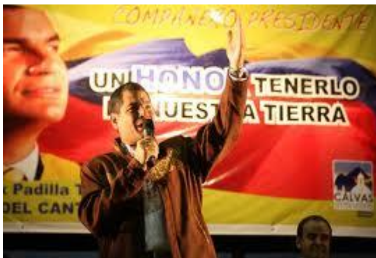
Rafael Correa en la campaña electoral 2006.

La rebelión del 21 de Enero en contra de Jamil Mahuad, generó la entrada en escena de un militar que eventualmente llegaría al poder y cuyo nombre es Lucio Gutiérrez. Este a través de alianzas con los partidos de izquierda y el movimiento indígena asumió la Presidencia; sin embargo, ya se veía en la opinión pública nacional, la pérdida de legitimidad de los partidos políticos. Pero su mandato no se sostuvo por mucho tiempo. Las fuerzas de la clase media en Quito y muchos sectores de la izquierda se levantaron en las calles y lo derrocaron, 46 dejando el gobierno en manos de su vice-presidente, Alfredo Palacio. Para entonces, Rafael Correa un joven Ministro de Economía en el 2005 que se niega a obedecer las órdenes de los organismos internacionales de crédito, salta a la palestra política. 47