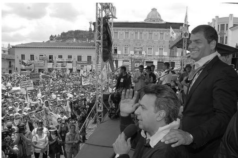
Rafael Correa y Lenin moreno en la campaña electoral Para las elecciones del 2006 en la plaza de San Francisco de Quito.

Otro elemento fundamental que acerca este proceso con otros del llamado populismo clásico es que Correa se esfuerza por nombrar a sus enemigos a través del adjetivo de “Pelucones”. Velasco y Abdala los nombran bajo el calificativo de “Oligarquías”, “Aniñados”. De esta manera construye del mismo modo que estos presidentes una suerte de personajes antagónicos que representan el mal del cual hay que defenderse y dónde debe recaer toda la culpa de la inmoralidad, la corrupción y el pecado. Estos personajes se transforman en el “poder” aborrecible, al cual hay que derrotar. 54 “exacerbando los conflictos, los desacuerdos y las pugnas de poder para afianzar su liderazgo. Con ello ha seguido jugando el rol que parece fascinarle: estar todo el tiempo contra el poder, sin darse cuenta de que él mismo se ha convertido en una nueva forma de poder bastante arbitraria y autoritaria” (Burbano, 2007:41).