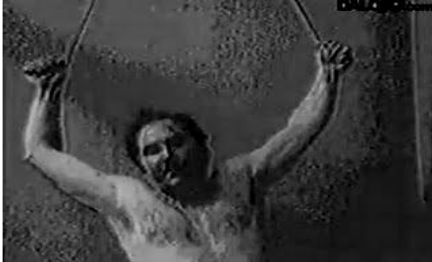
Abdalá Bucaram Ortiz, imagen tomada de un Spot publicitario en su campaña 1996.

un mártir al cual las injusticias, lo han llevado a la cárcel y a la tortura, es en pocas palabras la imagen de un Jesucristo Populista.