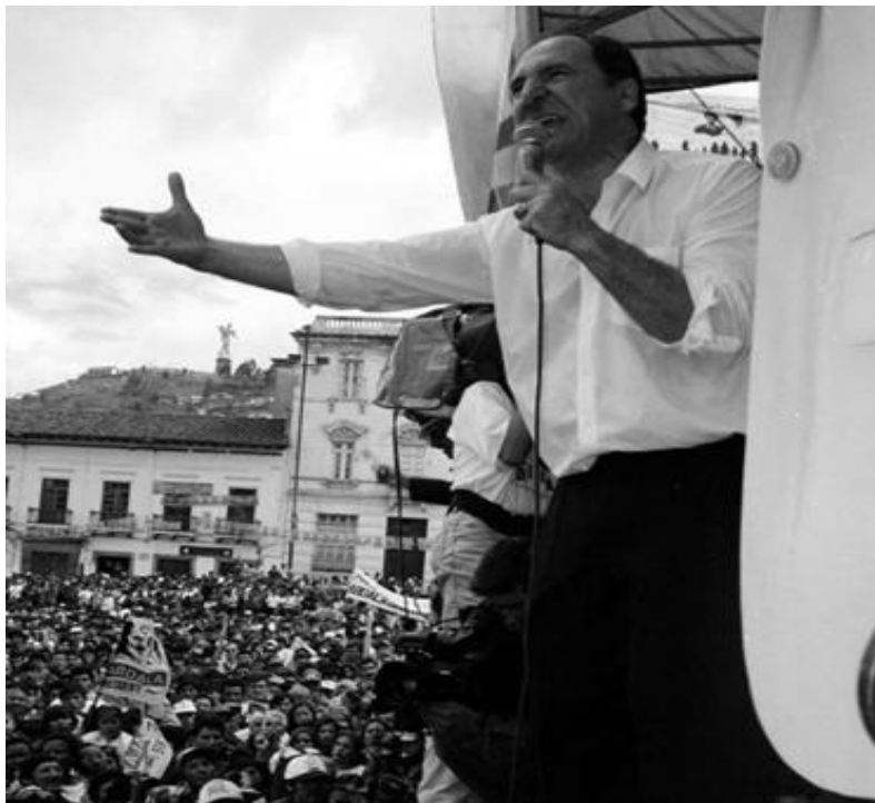
Abdalá Bucaram en un mitin político en la Plaza de San Francisco de Quito, 1996.

... un día soñé con la virgen que me dijo ya eres libre, regresa junto a mi pueblo y sálvalos de la miseria. Te unirás a los perseguidos y firmarás una patria libre, vencerás a un no creyente, porque el mismo diablo lo viste de bueno voy a moralizar al país.... (Abdala Bucaram).