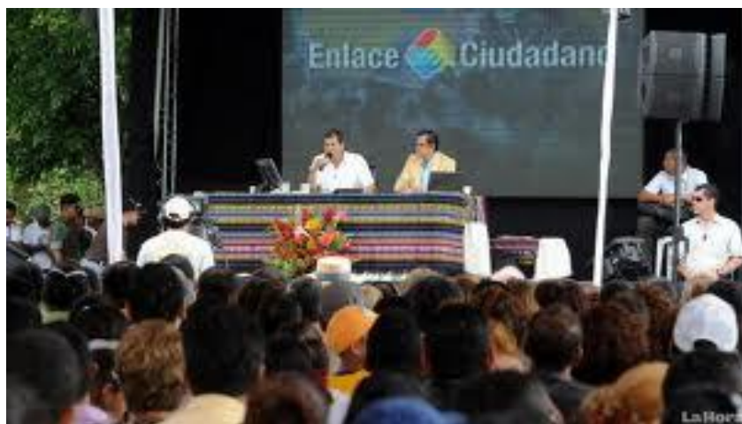
Rafael Correa en el Enlace sabatino 2011