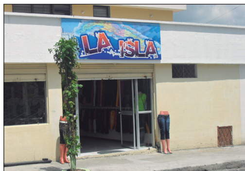
Negocio Barrio La Florida-Quito

Lo interesante de El Paraíso, por su parte, es que este no es concebido, ni por la población guayaquileña en general ni por la población cubana en particular, como un barrio cubano, y no se encuen-