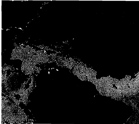
Graf. 3 Fotografía del Museo Marino de Margarita. Sala 1El mar Venezolano, mostrando Temperaturas Las zonas amarillas i ndican temperaturas elevadas. Los colores verdes, que se extienden a todo lo largo de las costas caribeñas del país, indican temperaturas más bajas.

El tiempo de permanencia de un humedal típico parece estar en el orden de algunos cientos a varios miles de años (Iriondo, 1990); si las condiciones geológicas lo permiten, los humedales se formarán recurrentemente en la misma región a lo largo de decenas de millones de años, lo que es de gran importancia evolutiva.