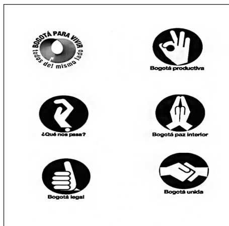
Imagen 2. Gestos de manos.

imágenes de ‘pulgares hacia arriba’ y de símbolos de manos con la señal de ‘ok’. Estos símbolos debían representar a una ‘Bogotá legal’ y una ‘Bogotá productiva’, a pesar de que la mayoría de gente simplemente apreciaba sus connotaciones positivas. Incluso las luces navideñas de diciembre de 2002 que colgaban sobre la plaza Bolívar simbolizaban una gran mano mostrando el signo de ‘ok’, mientras que otra mano similar se podía apreciar sobre Bogotá, descendiendo desde lo alto de Monserrate, la montaña que delimita la parte oriental de la ciudad.