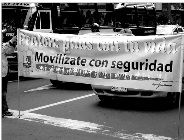
Imagen 3. Tránsito peatonal.