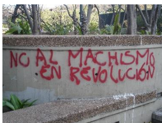
(Graffiti frente al Teatro Teresa Carreño, Caracas, marzo 2014)