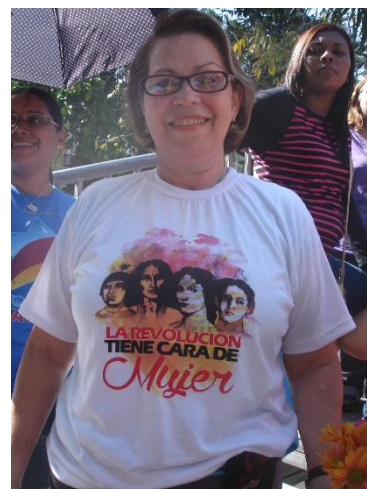
Autora: María Emilia Durán García ("La Revolución tiene cara de mujer")

Puedo optar por continuar indagando pero me detengo porque en ese momento descubro que este sujeto masculino, encargado de una dirección pública, reproduce una lógica masculina de poder sobre mí, no solo rehúsa atenderme, sino que es “ella”, sujeto