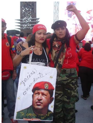
Autora: María Emilia Durán García (“Gracias comandante”)

fotografía, una mujer blanca representa a la oposición venezolana siendo agredida por el otro sector político.