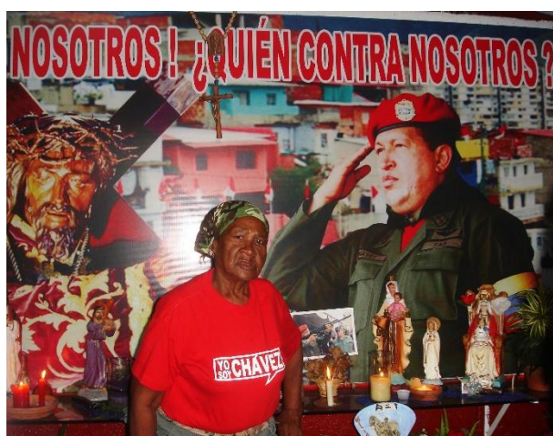
Autora: María Emilia Durán García (“¿Quién contra nosotros?”)

“SOS-Paz Venezuela”, entre otras. En el centro de las fotografías resalta la imagen de la Virgen María y una bandera de Venezuela con siete estrellas. Esta bandera representaba a la cuarta república y fue modificada, luego que la Asamblea Nacional agregara una octava estrella a la misma en el año 2006 11 como nuevo símbolo de la quinta república. La presencia de la imagen mariana liderando el lugar alude al carácter devoto de las y los manifestantes y al poder otorgado a la religión en la resolución del conflicto a favor de su posición política. También la presencia de la bandera con siete estrellas refleja el ideal de país con el cual se identifica este grupo social, es decir, el modelo de la cuarta república antes de la llegada de Chávez. Más aún, si la bandera es un símbolo material de la nación, que expresa los valores alrededor de los cuales un colectivo se reconoce, entonces al menos para una parte de la oposición política, en el modelo anterior se encuentran aquellos valores más adecuados para la nación y el estado.