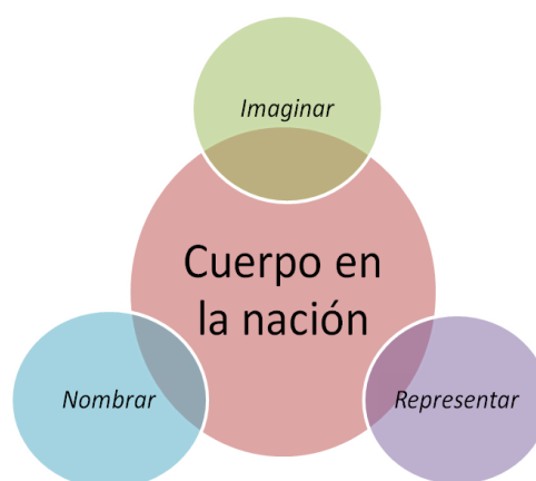
Gráfico n° 2: Formas de poder sobre el cuerpo y la nación

tomados o no como parte de una continuidad o ruptura con el discurso de la nación. Por el hecho de ser una construcción abstracta, la nación resulta una categoría muy dinámica para aprehender ciertas representaciones dominantes y aquellas que de alguna manera pudieran transgredir el orden social heteronormativo y resignifiquen el discurso y, por ende, la praxis material.