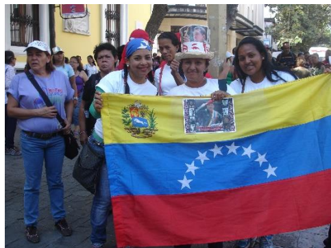
Autora: María Emilia Durán García (Día Internacional de la Mujer Plaza Bolívar-Caracas marzo, 2014)

¿Ustedes saben quién más influye en los valores del hombre o la mujer cuando uno está chiquitico o está niño? Es la mujer en el hogar, sea la abuela, o la madre o la tía. Son las que modelan lo que uno va a ser (...) La mujer tiene un papel preponderante para formar hogares de la patria, hogares democráticos, de respeto, donde nos respetemos hombre y mujer (...) (Maduro, 2014, Discurso oficial).