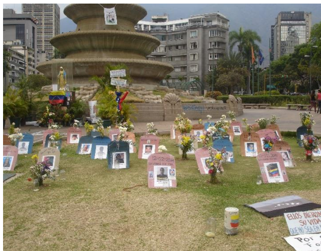
Autora: María Emilia Durán García (“Ellos dieron su vida. Resistencia”)

A continuación veamos como las fotografías hablan de estos imaginarios.