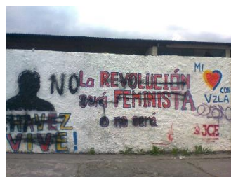
Autora: María Emilia Durán García (Graffiti en la avenida Amazonas, Quito, mayo 2014)

La sexualidad dentro del discurso de la nación es también expresión de privilegios y privilegiados, por ello su regulación no sólo aspira a ordenar la reproducción como una actividad socialmente constituida, sino a mantener ciertas posiciones dentro del orden nacional que garanticen su continuidad. La sexualidad se abre como un campo de disputas de significados y prácticas corporales. Se trata de una fuente de representación y construcción simbólica de la realidad: “la sexualidad es la matriz densa que permite la proliferación de poder a través de la producción de conocimiento y la verdad” (Puri, s/f: 17). Este carácter de “verdad” se vuelve relativo, complejo y cuestionable cuando se intenta unificar todos los aspectos sociales y culturales que simbolizan a la nación, sobre todo, porque las sexualidades de las y los sujetos son expresiones individuales y colectivas de una heterogeneidad, muchas veces negada o explotada pero que igual conforman a la nación.