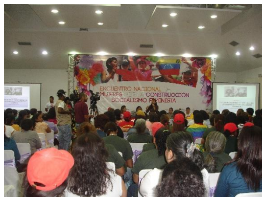
Autora: María Emilia Durán García (Encuentro Nacional de Mujeres por la Construcción del Socialismo Feminista, 7 de marzo, Caracas)

Durante el Encuentro Nacional de Mujeres por la Construcción del Socialismo Feminista, en Caracas, el día siete de marzo, algunas de las participantes comenzaron sus intervenciones señalando que hablaban “Como madres, como mujeres, como feministas, como antiimperialistas, chavistas y socialistas.”