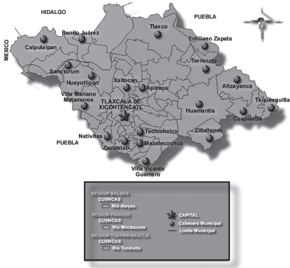
Figura 1 Mapa de localización del municipio de Tlaxco y municipios que integran su área de estudio en la región como Apizaco y Tlaxcala, México

Fuente: Cuenca Río Atoyac (18 A) y el río Zahuapan (18 AI). Este último río es la principal corriente de Tlaxcala. (México > Información Geográfica > Mapa con Regiones Hidrológicas)