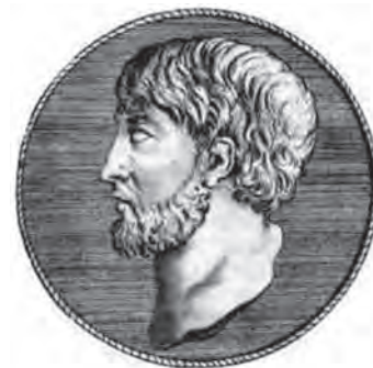
Figura 2 Arquímedes de Siracusa

Marshall Clagett (1970/1985), en el Dictionary of Scientific Biography señala que el trabajo matemático de Arquímedes se clasifica en tres grandes grupos. En el primero se pueden colocar las pruebas de los teoremas relativos a los volúmenes y figuras geométricas limitadas por líneas curvas y superficies. El segundo, comprende trabajos que llevan a un análisis geométrico de la estática y problemas hidrostáticos, así como el uso de la estática en la geometría.