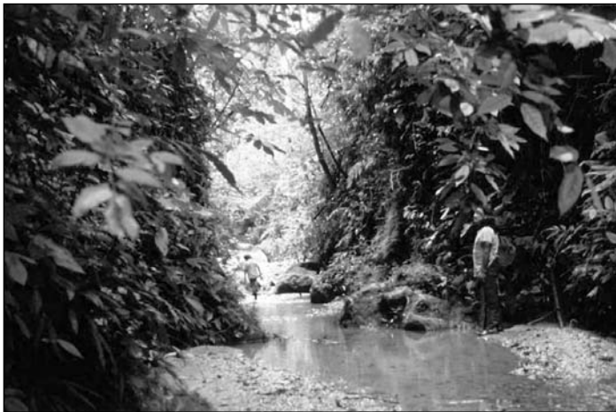
Camino en la selva

mantes recalcaron la disciplina de trabajo de la misión. Solo un sujeto debidamente disciplinado podría concebir el ser parte de una red homogénea en la cual, conjuntamente con otros sujetos igualmente disciplinados, compondrían una orden de estado fraternal. Sin embargo, al ser niños nacidos bajo otro sistema de disciplina, estos alumnos de las escuelas de la misión estaban agudamente conscientes de la función política de esta disciplina.