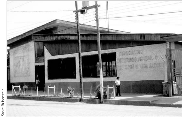
La sede en Sucúa

el IERAC y el CREA para resolver disputas territoriales no resueltas. El gobierno accedió a remover e indemnizar a los colonos “no-shuar” que vivían dentro de los linderos de los centros shuar. Los colonos que poseían al menos diez hectáreas eran inmunes a esta provisión, pero si alguna vez decidían vender su tierra, debían vendérsela al centro. El gobierno aseguró a los centros con al menos sesenta familias que se les otorgaría entre sesenta y ochenta hectáreas para cada hombre mayor de dieciséis en condiciones de trabajar, con diez hectáreas reservadas para la plaza comunal. A los centros con menos familias se les daría tres años de plazo para mancomunarse si deseaban beneficiarse de este acuerdo. Finalmente el gobierno estableció un sistema “global” para la propiedad de la tierra, en el cual las familias individuales obtenían un título que podría ser comprado, vendido, y heredado solamente dentro de la comunidad. 12 Al tratar a los shuar como colonos, el gobierno ratificaba su soberanía sobre el territorio y usaba a la Federación como un instrumento administrativo del estado. Los líderes de la