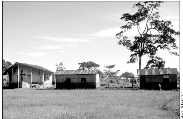
El centro con una capilla

tatutos y formaron la Asociación de Sucúa, ambos aprobados por el gobernador de la provincia y por el magistrado (jefe político) de Sucúa. La recién formada asociación tenía que construir senderos, escuelas, centros de salud y capillas. Shutka organizó semanas de trabajo en donde tres personas de cada centro trabajaban exclusivamente en un solo centro.