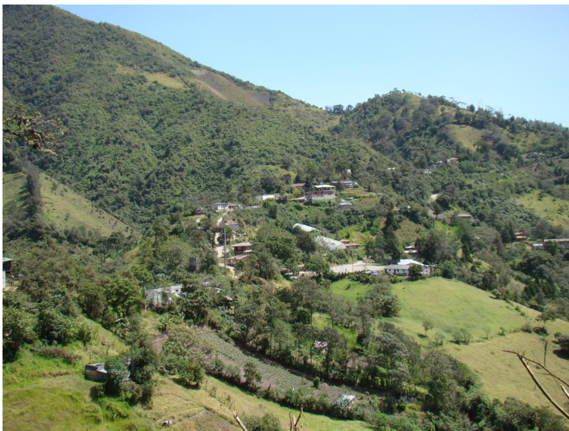
Fotografía: Paola López, 2013