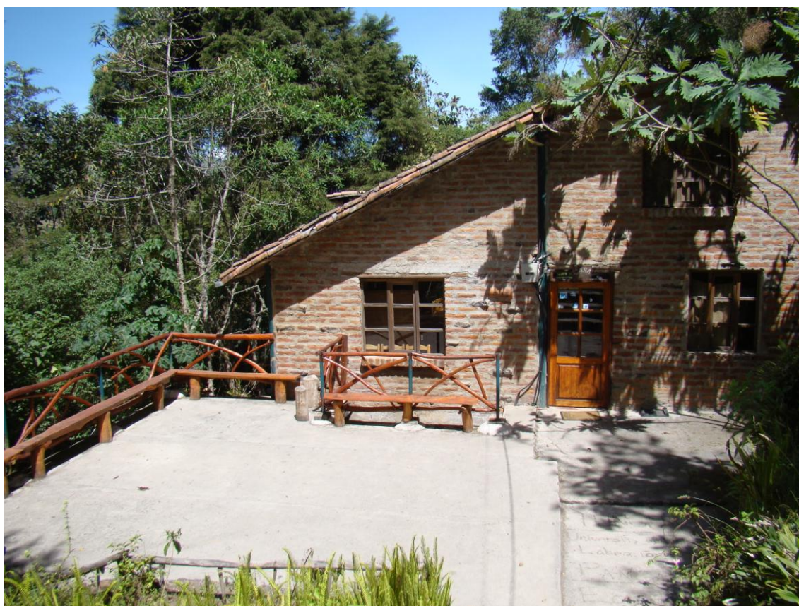
Fotografía: Paola López, 2013