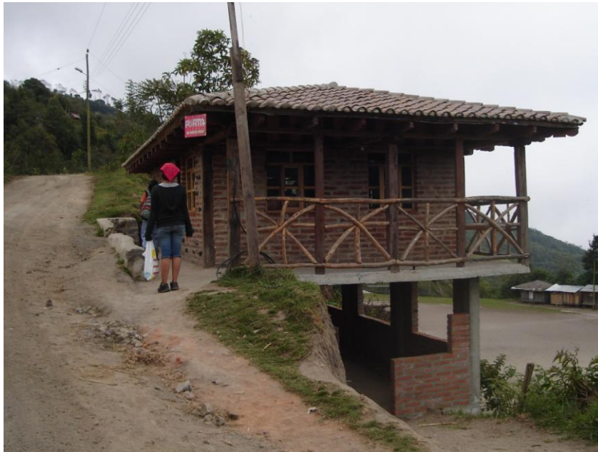
Fotografía: Paola López, 2013