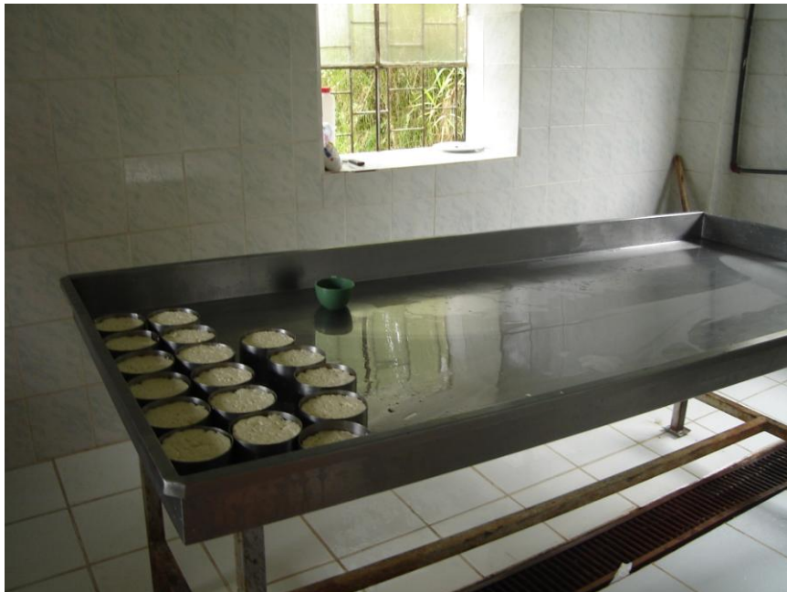
Fotografía: Paola López, 2013