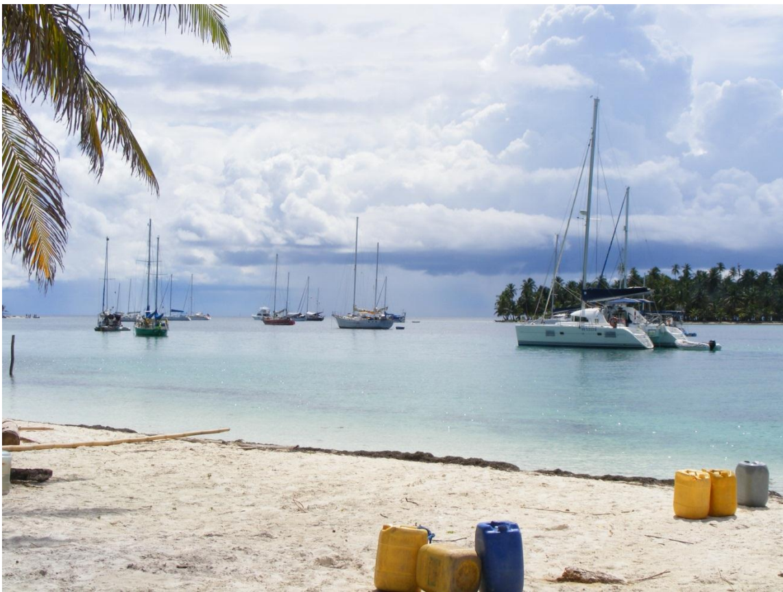
Figura 3 Veleros en Chichimé, comarca de Gunayala

Cartagena, sólo viajan de Miramar o Gardi a Sapsurro (primer pueblo después de la frontera). Los veleros tienen una capacidad variable. Los hay que admiten dos mochileros y los hay que en el mismo espacio pueden llevar a 6 personas. Tanto en la ciudad de Panamá como en Cartagena hay una red conformada por capitanes de barcos y hostales que gestionan la travesía de los mochileros. Por Internet también es posible establecer contactos con algunos de los capitanes.