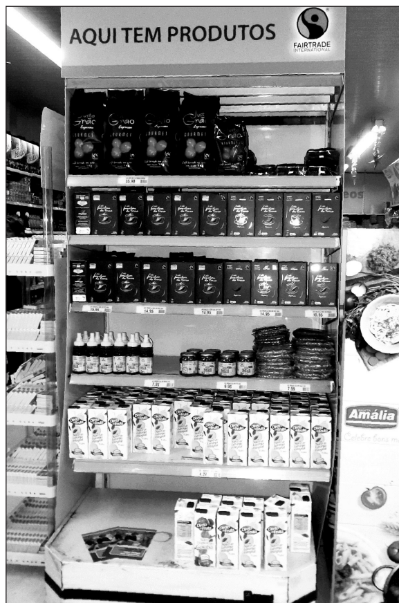
Figura 3. Productos Fair Trade en Poços de Caldas, Brasil