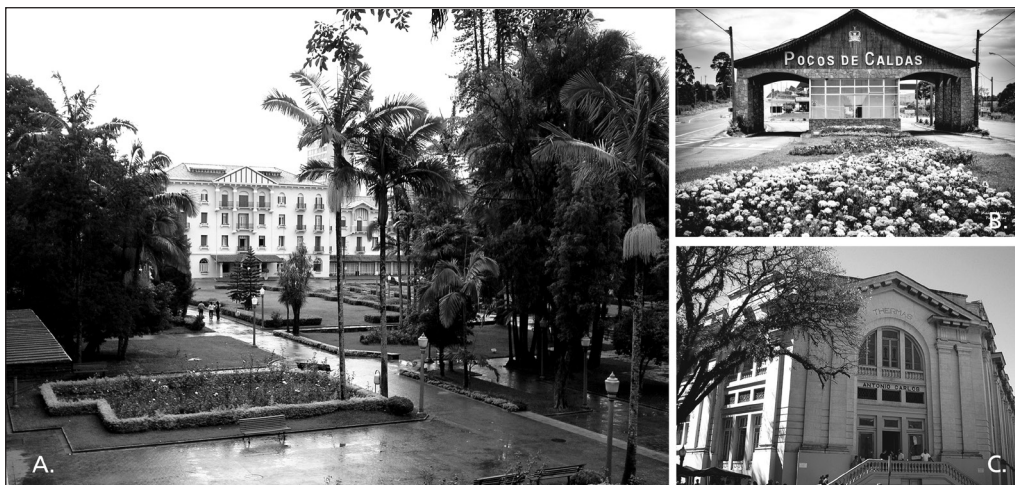
Figura 2. Ciudad de Poços de Caldas, Brasil

A) la izquierda, Praça José Afonso Junqueira, con el antiguo casino.; B) En la esquina superior derecha, portal de entrada de la ciudad.; C) En la esquina inferior derecha Thermas Antônio Carlos..