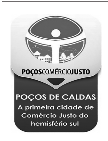
Figura 1. Logo de la Ciudad del Comercio Justo de Poços de Caldas

A pesar de la reciente participación brasileña en el Comercio Justo, una iniciativa fue destacada, al proponer la implantación del consumo de productos Fair Trade en el propio país. En el año 2012, Poços de Caldas se convirtió en la primera Ciudad del Comercio Justo de América Latina y en un país productor. La idea surgió en el año 2009 durante la certificación Fair Trade por la FLO y la Associação dos Agricultores Familiares do Córrego D'Antas (Assodantas) –una organización productora de café de Poços de Caldas. Con la certificación de Assodantas, miembros de la Secretaria Municipal de Desenvolvimento Econômico e Trabalho del municipio, conocieron el proyecto de la Ciudad del Comercio Justo e iniciaron su proceso de implantación.