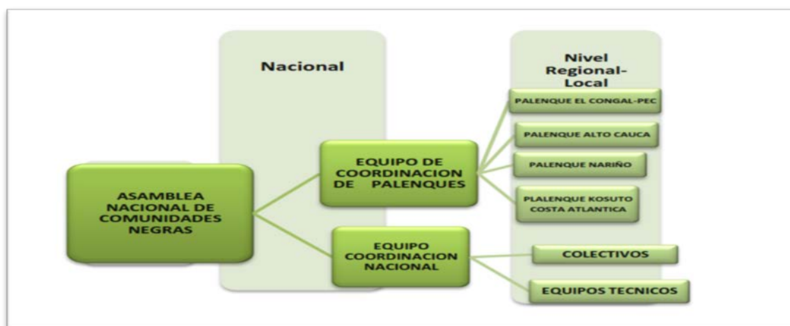
Grafica 1. Estructura nacional del PCN