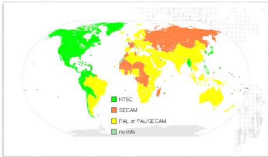
Gráfico 2.1 La televisión analógica en el mundo