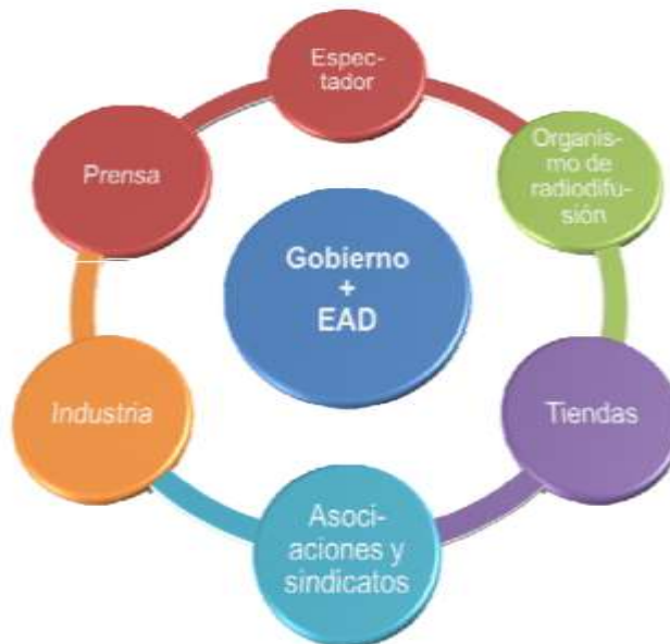
Gráfico 2.4. Plan de comunicación para la implementación de la TDT en Brasil