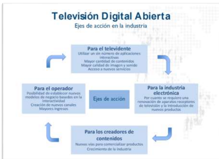
Grafico 2.3. Ejes de acción en la industria de la televisión abierta Argentina