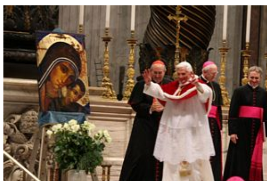
Figura 4.3: El papa saluda al Camino neocatecumenal en sus 40 años en Roma 139

“Ese espeso cóctel en el que se mezclan las prácticas de los primitivos cristianos con la tradición hebrea; las prácticas evangélicas de interpretación literal de las Escrituras con las terapias de grupo; las guitarras, las palmas y las danzas con las fórmulas de predicar itinerantes de las sectas protestantes. Sin olvidar la similitud ideológica con los Cristianos Renacidos estadounidenses, que auparon al poder a George W. Bush” (Rodríguez, 2008) 138 .