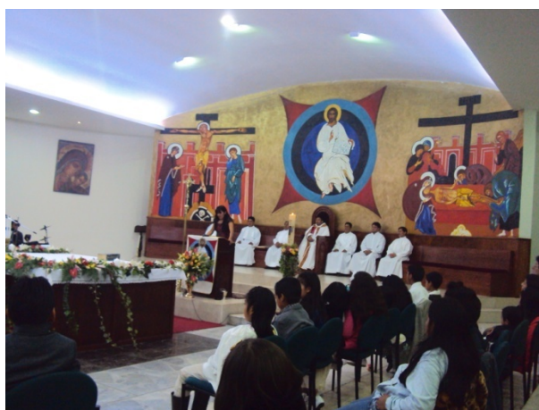
Figura 3.2: Iglesia de la Parroquia San Martín de Porres, Ferroviaria Alta

“Kiko [...] es el iniciador . Nadie le cuestiona. Es el autor de los textos y símbolos. De la estética, música y canciones; ritos y prácticas; el lenguaje y la forma de vivir. Incluso del diseño de sus iglesias, cuyas pinturas de inspiración neobizantina él mismo ejecuta” 122