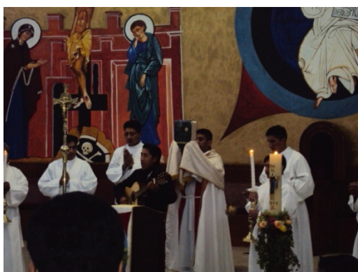
Figura 4.12: Proclamación del evangelio en canto, junto a una guitarra

Durante la lectura o proclamación del evangelio, el presbítero relató la resurrección de Jesús cantando y acompañado por una guitarra.