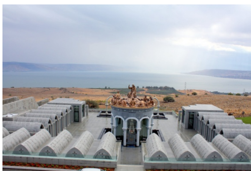
Figura4.1: El Domus Galilaeae, en el centro escultura de Jesús junto a los doce apóstoles, diseñada por Kiko Argüello.

de años de formación. Podría decirse que es el objetivo simbólico y geográfico hacia donde van todos los catecúmenos del mundo, el bautizo en el Domus Galilaeae.