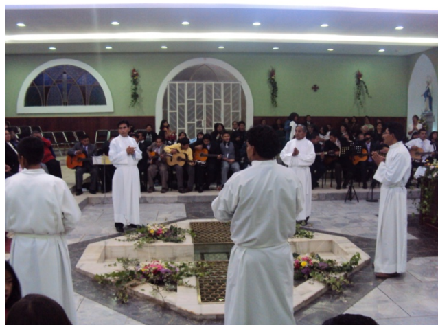
Figura 4.13: Hombres vestidos de túnicas blancas alrededor de la fuente bautismal, lista para ser bendecida

Los niños eran desvestidos mientras el sacerdote ingresaba a la fuente bautismal para bendecir el agua e iniciar la ceremonia.