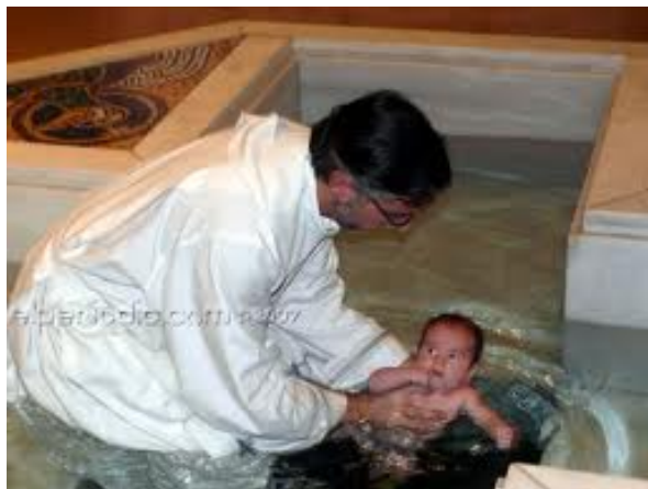
Figura 4.7: Bautizo Neocatecumenal por el Rito de Inmersión 164

cabo en una fuente bautismal sumergiendo a los niños con el rito de inmersión 162 , considerado también parte de un rito de purificación pre nuevo testamento, conocido también como el “bautismo del prosélito” 163 , en una ceremonia importante durante la Vigilia Pascual.