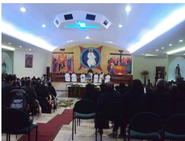
Figura 4.8: Los hombres se sientan junto al sacerdote durante las celebraciones

Constantemente volteaban a mirarme y aún más sostenían la mirada si justo en ese momento me encontraba haciendo algún tipo de anotación o permanecía con mi grabadora en la mano. Al parecer este era un grupo bastante cerrado que se incomodaba ante la presencia de gente que no pertenecía a sus comunidades; si bien había lugares en donde se nos permitía compartir sus celebraciones -como las liturgias sabatinas-, en otros casos el ingreso era totalmente restringido.