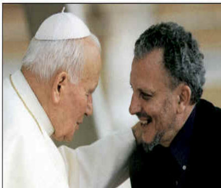
Figura 4.6: Kiko Argüello junto al Papa Juan Pablo II, su máximo colaborador del camino 152

divorciado?". "A ver, tú, cuéntanos tu vida. ¿Cuántos hijos tienes?". Es carismático. Lo más parecido a un telepredicador que tenemos en España”(Ibid.)