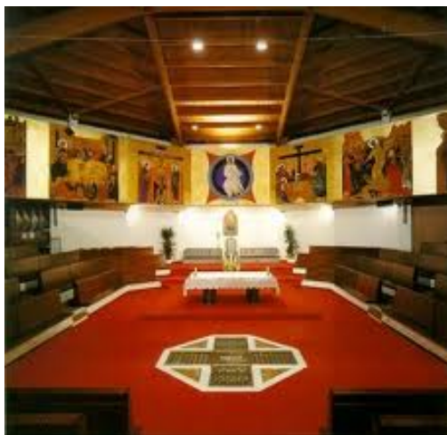
Figura 4.4: Catedral de Almudena, pantócratos pintados por Kiko Argüello 140 141

bastante comunes en Rusia y que han sido ubicadas en todos los murales de las iglesias y basílicas neocatecumenales del mundo.