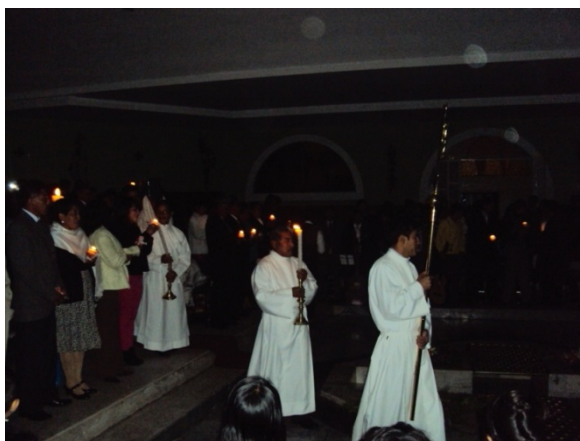
Figura 4.11: Ingreso del presbítero y responsables portando cirios, al inicio de la Vigilia Pascual

El sacerdote continuó con una oración en la que bendijo la ceremonia dando inicio a la primera parte de la Vigilia, luego salió junto a los seis hombres para hacer un nuevo ingreso a modo de procesión. Los responsables de las comunidades hicieron en ese momento, la entrega de los cirios a cada miembro 215 que luego fueron encendidos y luego se pusieron de pie para esperar la entrada del presbítero y sus acompañantes. En este momento las luces fueron apagadas en toda la iglesia.