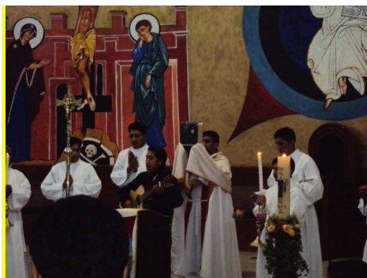
Figura 4.5: Iglesia de la Ferroviaria Alta el día de la Vigilia Pascual

Esto demuestra la gran influencia que tiene la Iglesia Ortodoxa de Europa del Este sobre el arte implantado en el movimiento neocatecumenado, las dos originarias del Cristianismo pero divididas en el Imperio Romano. Para los Rusos “las imágenes sagradas deben ser escritos de acuerdo con determinadas reglas y cumplir ciertos requisitos. Los cristianos ortodoxos dicen que los iconos se escriben y no se pintan; en la Antigüedad las imágenes de la biblia eran como libros, para quienes no sabían leer)” 147 .