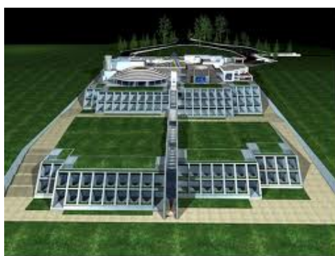
Figura4.2: Vista panorámica del Domus Galilaeae en Tierra Santa