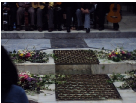
Figura 4.10: Fuente bautismal ubicada al centro de la iglesia

La iglesia estaba decorada con flores y velas en su mayoría blancas, al centro la fuente bautismal se encontraba también muy bien decorada y llena de agua caliente para llevar a cabo los bautizos. Los catecúmenos se ubicaron en bloques como lo hacen siempre, intentando no mezclarse entre comunidades; las dos primeras filas de adelante, estaban reservadas para los niños quienes también estaban destinados a amanecerse y a cumplir cada una de las actividades de la Vigilia.