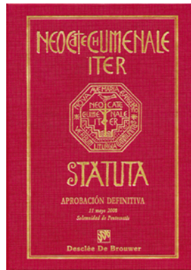
Figura 3.1: Aprobación definitiva de los estatutos del Camino neocatecumenal, 11 de mayo 2008

La realización del Camino en las comunidades no debe variar porque todo tipo de actividad o ritualidad se basa en las líneas propuestas por los iniciadores y publicadas en el Estatuto o en los volúmenes titulados Orientaciones a los Equipos de Catequistas 72 . Sobre la naturaleza y la realización del Camino, resumidos en el art. 1 y 2 por ejemplo, se habla de un “camino al servicio del obispo [...] al servicio de la catequesis y la educación permanente de la fe”; se la realiza “bajo la jurisdicción, la dirección del Obispo diocesano 73 y con la asistencia, la guía del Equipo Responsable internacional del Camino , o del Equipo responsable delegado, ...” (2008: 22- 23).