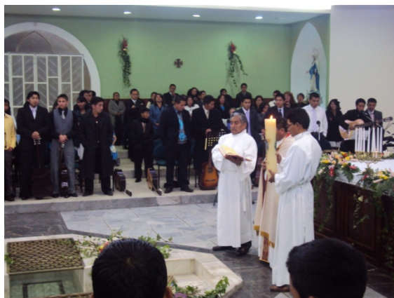
Figura 4.9: Durante la bendición del agua en la Vigilia Pascual catecumenal de la parroquia