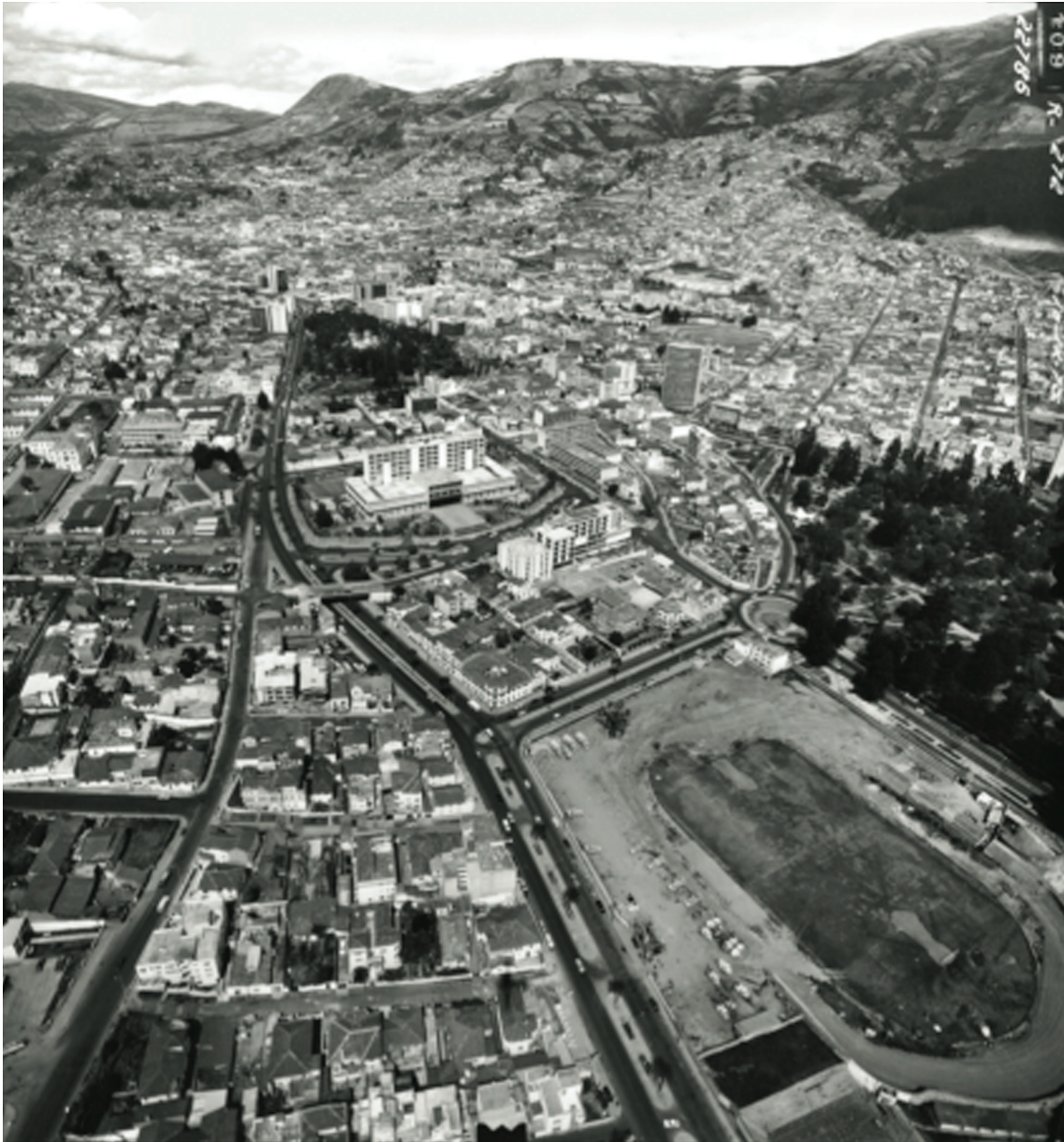
Foto 8: Vista panorámica del Estadio el Arbolito en 1957 ubicado en la esquina inferior derecha.

pero de ningún modo de identificación 5 .