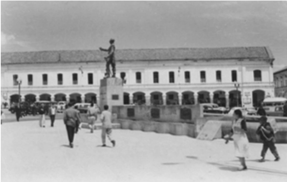
Foto 6: Plaza de Santo Domingo, a fines de los años 70.