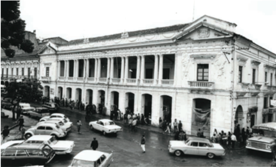
Foto 5: Calle Chile, al noreste de la Plaza Grande, en la década de los 70.

cuerto de la escena callejera. Las hojitas de papel periódico eran “diferentes a la poesía convencional, hija del oficialismo que copia el imperialismo de la cultura occidental, y donde la letra, si no es letra muerta, es letra de cambio” (Ibíd.).