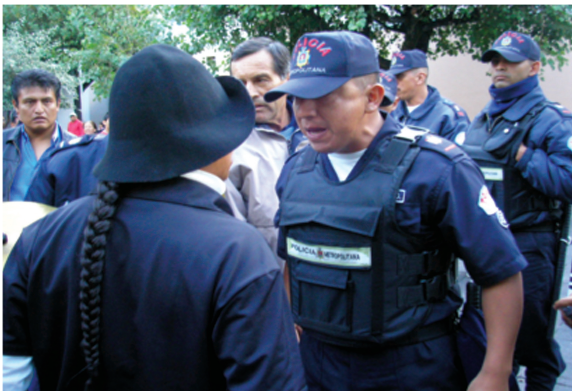
Foto 17: El Grupo Perros Callejeros inició su ruedo en la Plaza Chica el 16 de junio de 2009. Los Policías Metropolitanos llegaron a verificar el permiso para el uso de ese espacio público. Los Perros no tenían “permiso” y fueron expulsados por ocho Policías y varios refuerzos motorizados.

La actitud de permanente confrontación a Estado, no busca la “automarginación” sino que negocia una posición visible, como ellos dirían: un “ladrido constante”, mediante el que proponen “la búsqueda de una apreciación estética del público popular hacia las artes escénicas en la calle” (Ibíd.) y reconocen que debe “cualificarse [el teatro de la calle], diferenciándose de otros respetables oficios como son los charlas, brujos, vendedores, etc.” (Ibíd.).