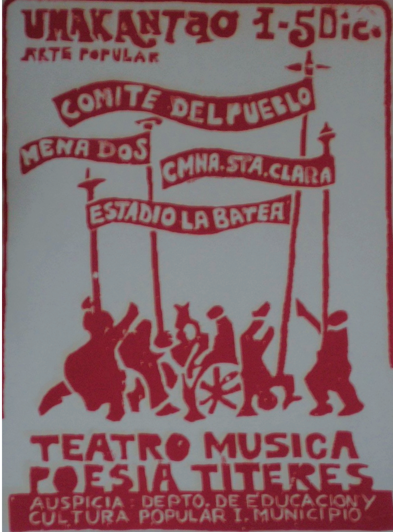
Ilustración 2: Afiche de Umakantao.