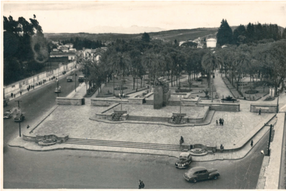
Foto 2: Plazoleta Bolívar del parque La Alameda en 1935.

Cuando Cicerón dice “todo el mundo fue a parar ahí” se refiere en términos de Bourdieu (1984) al “campo” de legitimación de artistas con compromiso social quienes se sumaron a las “acciones urbanas” con el objeto de compartir sus producciones en espacios abiertos, sin que esta práctica o actitud personal impida o deslegitime su presencia en espacios de “alta cultura” (Bourdieu, 1984), es decir en teatros y galerías. Se debería hablar en realidad de un espacio de legitimación paralelo propio de un tipo de intelectualidad que había optado por una formación en gran medida autodidacta y por una producción creativa ligada a la vida popular y a los espacios públicos.