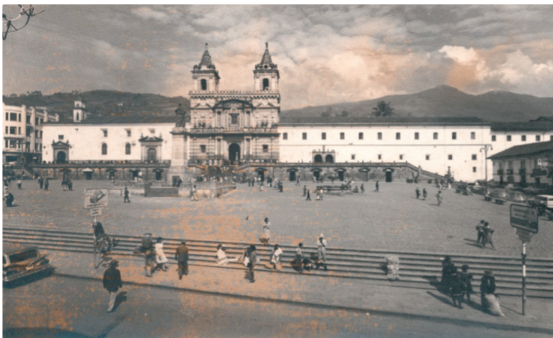
Foto 7: Plaza de San Francisco a fines de los 60. Aproximadamente en 1972 se sacó de ahí el monumento de Monseñor González Suárez. La calle Bolívar al norte fue la de mayor ocupación del comercio formal e informal como continuación de la zona del Tejar e Ipiiales.

A esta ciudad andina llega en 1976 una muchacha suiza con el deseo de aprender técnicas de tejido precolombino, quien sin saberlo, dejaría un legado maravilloso para el arte popular callejero de Quito: los títeres para niños, el maquillaje blanco y otros elementos que enriquecieron al teatro callejero.