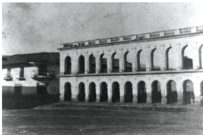
Foto: Plazuela de las Carnicerías. Foto de 1865.

La foto muestra en 1865 a la Plazuela de las Carnicerías, resalta la fachada de las carnicerías, sitio donde sería construido el Teatro Sucre 7 en 1886 y desde cuando pasaría a llamarse Plaza del Teatro.