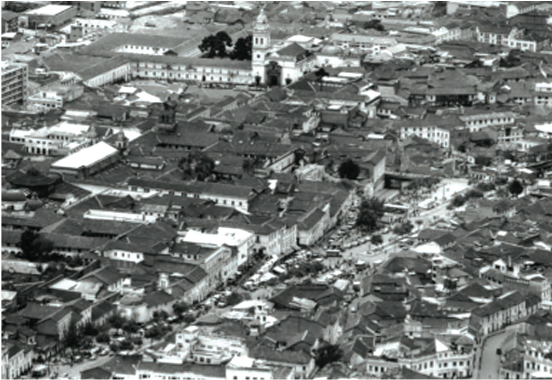
Foto 3: Avenida 24 de Mayo a inicios de los años 90. A la izquierda la Capilla del Robo.

en 1922 como parte de las obras del Centenario de la Batalla del Pichincha” (Ibíd.) 35 .