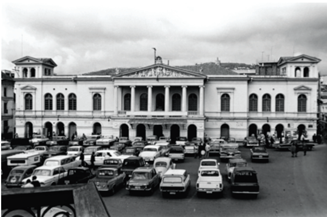
Foto 14: Plaza del Teatro en los años 70. Al fondo el Teatro Sucre. La imagen muestra su uso como parqueadero de los vehículos del sector.

La ciudad no fue diseñada para el vehículo, en la siguiente foto se ve uno de los principales usos de la Plaza del Teatro como un estacionamiento de automóviles del sector y de quienes asistía a los espectáculos del Teatro Sucre.