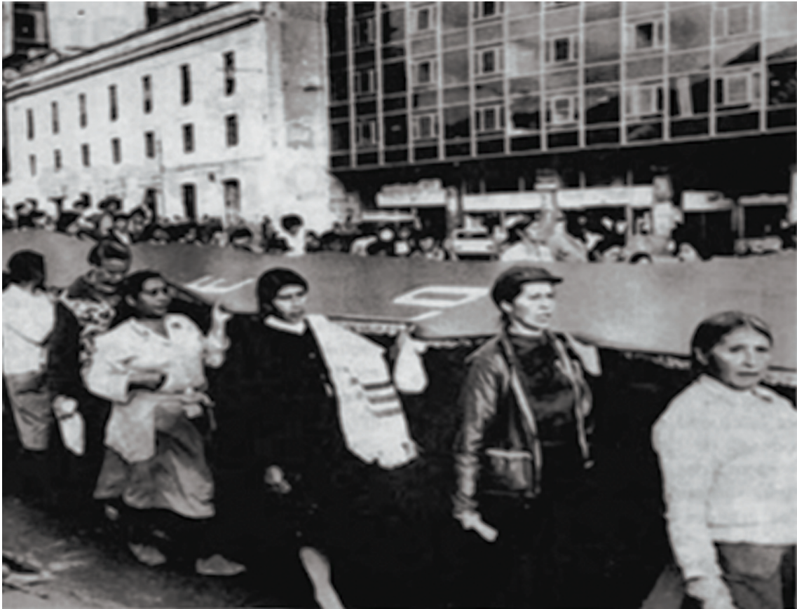
Foto 9: Marcha obrera de la Guerra de los Cuatro Reales en abril de 1978. Realizada en rechazo al alto costo de la vida, la corrupción y autoritarismo de la dictadura.

Lo interesante es que muchos de los temas, lenguajes, gestualidad de los teatreros populares fuera más allá de los que planteaba la intelectualidad letrada, cada vez más imbuída por los macrorrelatos de izquierda; pues la suya, era una militancia popular muy cercana a su cultura.