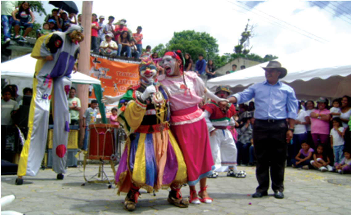
Foto 16: Grupo Perros Callejeros en “El Casorio de la Vaca”. Presentación en las Fiestas de Nanegal el domingo 23 de mayo de 2010 en la programación del Proyecto de Difusión Escénica Vamos a la Toma de la Plaza ejecutado por la Corporación Quijotadas con el auspicio del Ministerio de Cultura, la Secretaría de Cultura del Municipio del DMQ, Fonsal, El Telégrafo y la empresa Divertimentos.

callejero (...) de buena calidad, de buena elaboración” (Ibíd.).