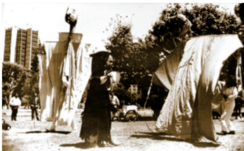
Foto 13: Grupo Saltimbanquis en la obra Apu Huayra (el viento) . Presentación en el parque El Ejido en los años 80.

Las obras del Grupo querían romper con la cultura oficial “que plantea solamente una actitud [pasiva] como espectador” y tras investigaciones de la Commedia dell’Arte 29 , propuestas de happening , las primeras indagaciones de la fiesta popular andina y una gira a los pueblos negros del caribe venezolano “descubrimos que la única forma de comunicación en nuestro continente era la misma que tiene los africanos, que son los tambores” (Ibíd., 94).