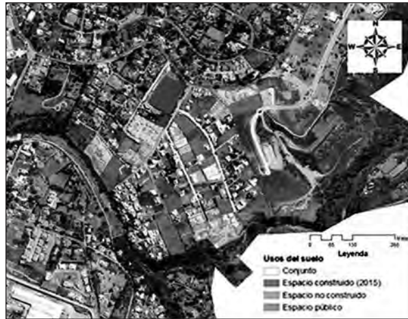
Mapa 4. Usos de suelo

Elaboración propia con base en fotografía satelital de Google Maps.