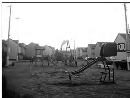
Imagen 1. Área de recreación en el conjunto Casales Buenaventura, construido entre 2001 y 2003

Los primeros conjuntos desarrollados a finales del siglo XX se caracterizaron por ser pequeñas construcciones realizadas por constructores particulares que compraron algunas de las antiguas quintas de la zona. Desde el año 2003 se iniciaron los grandes proyectos inmobiliarios instalados en antiguas zonas industriales o campos de cultivo. Los compradores correspondieron a las nuevas clases medias que obtuvieron créditos asequibles de parte del Estado a través del Instituto Ecuatoriano de Seguridad Social (IESS) y de bancos privados. Estos nuevos conjuntos se conformaron como verdaderas miniciudades que ofrecieron seguridad y acceso a la mayoría de servicios como pequeñas tiendas de abastos, servicio de guardería, centro médico, gimnasio o áreas de recreación.