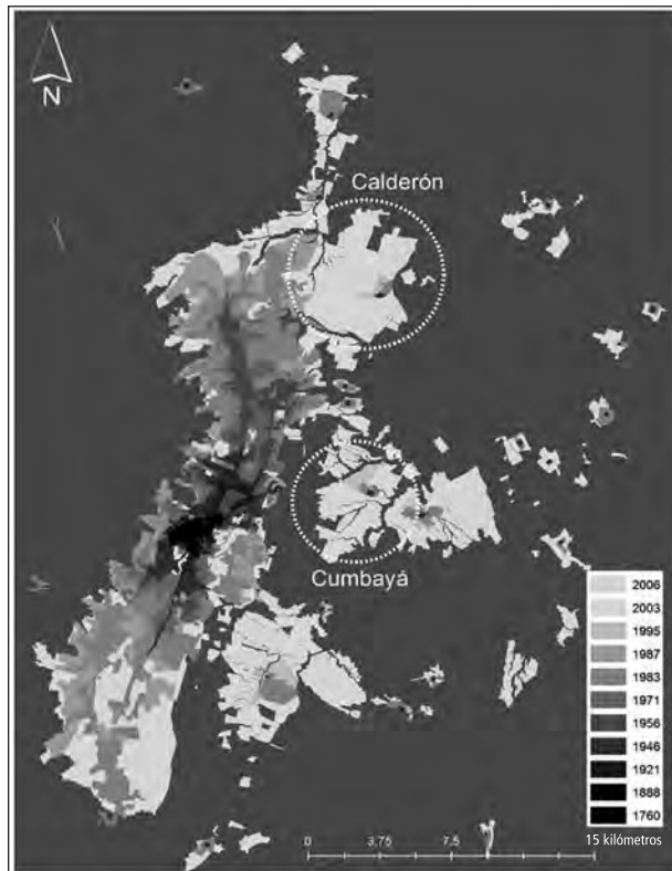
Mapa 1. Calderón y Cumbayá en el contexto del crecimiento expansivo de Quito, 1760-2006

Elaboración propia con datos del Instituto de la Ciudad del Municipio del Distrito Metropolitano de Quito (MDMQ).