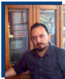
Marcos Martínez Ex Presidente Comisión de Relaciones Internacionales y Seguridad Pública del Estado

¿Cuál es el concepto de seguridad establecido en la Constitución del 2008?