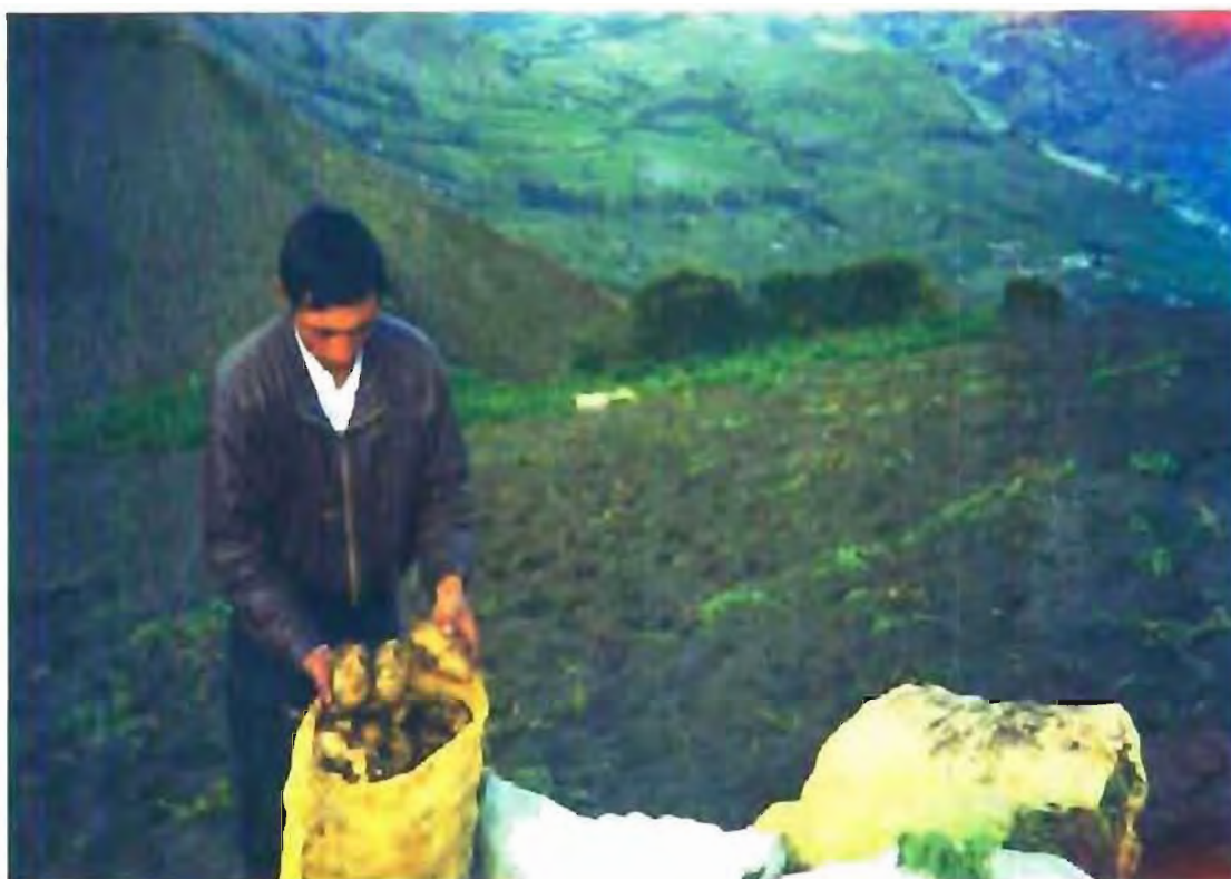
(FOTO) INTEGRANTE DEL CENTRO DE INVESTIGACIÓN AGRÍCOLA LOCAL- CIAL

En el año de 1.995 manejaron un FODECO por el valor de seis millones de sucres, (us 1500) para la producción de semilla certificada, con lo que han logrado un incremento notable en la producción local.