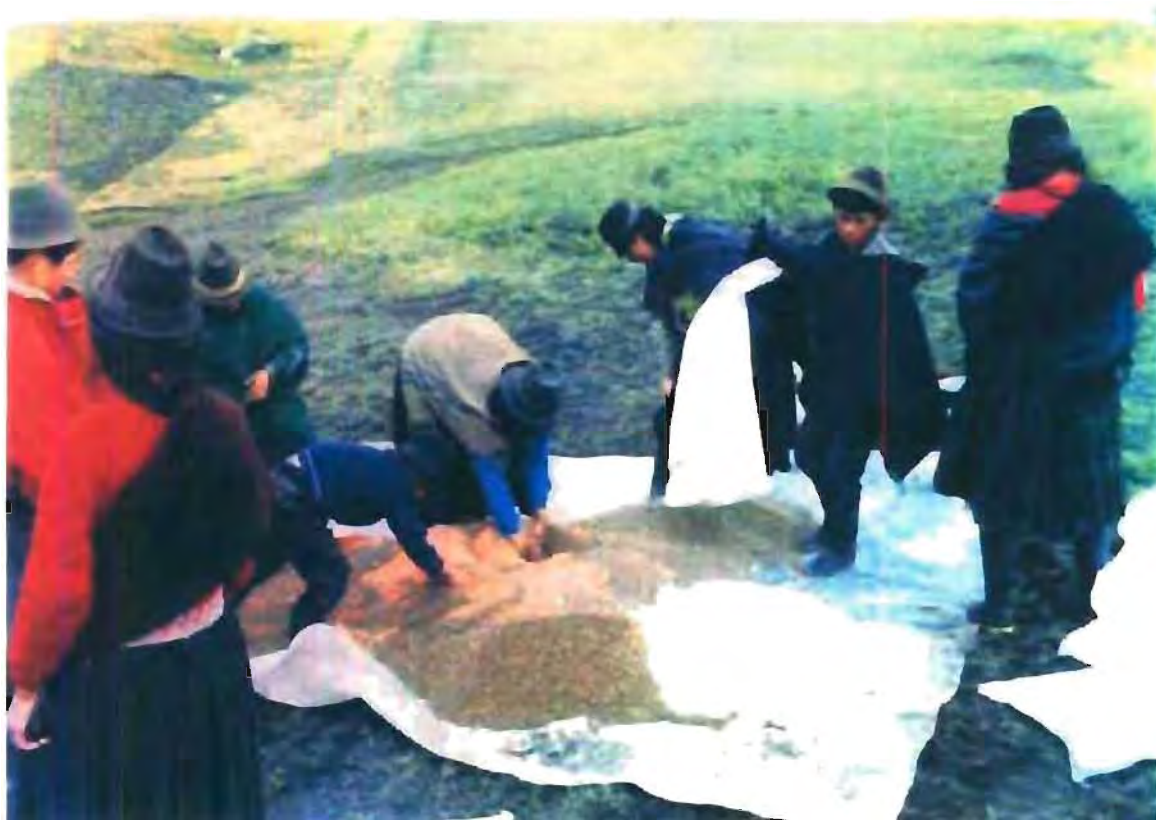
(FOTO) MUJERES DEL AREA GUANO ORGANIZADAS EN ACTIVIDADES AGRICOLAS