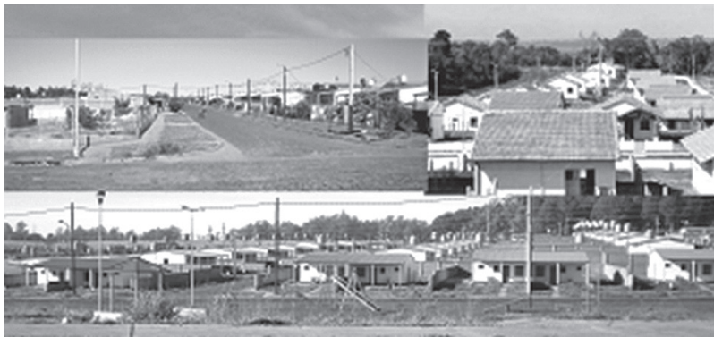
Imagen. 1. Panorámica de conjuntos habitacionales