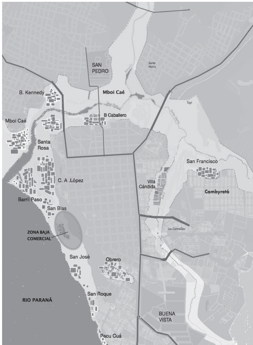
Figura 1. Ciudad de Encarnación, nuevo frente fluvial y áreas inundadas