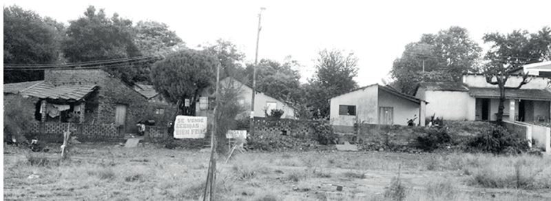
Imagen 3. Sector Mboi Caé. Viviendas próximas a la playa.

En diarios locales se ofrece la venta de lotes y casas en proximidad a la playa, tanto en Mboi Caé como en el barrio John F. Kennedy. Por otro lado, inmobiliarias ofrecen terrenos para hoteles, edificios de departamentos y locales comerciales 9 . De acuerdo a entrevistas realizadas con agentes inmobiliarios, se estima que las propiedades han incrementado su valor en torno al 200% en función de las obras de infraestructura que ha realizado Yacyretá en todo el tramo costero. Un agente inmobiliario entrevistado afirma que en la zona de Mboi Caé, producto de la especulación inmobiliaria, un lote de 300 metros cuadrados pasó de valer entre 30 y 50 millones de guaraníes a 150 y 200 millones. Tanto es así que, en instancias de trabajo de campo en el área, algunos informantes se ofrecían como intermediarios para la búsqueda y negociación de lotes con propietarios particulares.