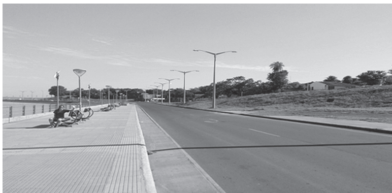
Imagen 2. Nueva costanera en el sector Pacu Cuá