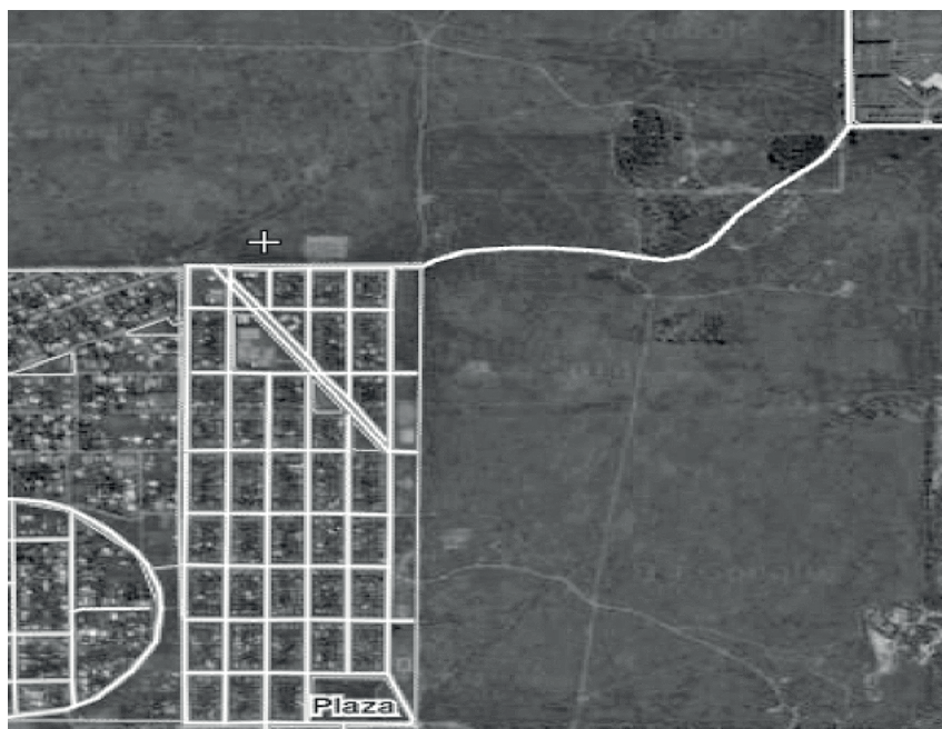
Imagen N° 2. Vista aérea de Ciudad Sol Naciente (638 casas)