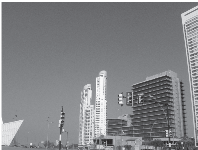
Imagen 3. Escultura “Barquito de papel” en Puerto Norte

y centros comerciales, cuyas siluetas definen las formas de un proceso de gentrificación 5 urbana que combina la construcción y la recualificación (Casgrain & Janoschka, 2013; Smith 2013).