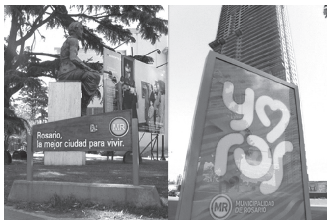
Imagen 1. Marca Ciudad

El espacio público funciona como vidriera de la marca ciudad no sólo porque en él se emplazan los logos y la publicidad urbana (Imagen 1), sino porque allí se exhiben los productos que le dan cuerpo. A continuación analizaremos los principales referentes de las representaciones urbanas oficiales en el proceso de construcción de una imagen, marca y modelo donde el espacio público se consolida como entorno de lo cultural en diversas manifestaciones.