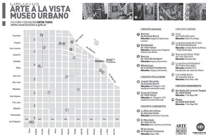
Imagen 5. Circuito Museo Arte a la Vista

Con respecto al patrimonio cultural intangible, en todos los planes analizados, es constante la apelación a las personalidades de la ciudad como símbolos de identidad urbana y patrimonio cultural. Se configuraron los circuitos urbanos del revolucionario “Che” Guevara, el humorista “El Negro Olmedo”, el político “Lisandro de la Torre”, el artista “Lucio Fontana” y el “Paseo los olímpicos” 12 en homenaje a deportistas rosarinos. En este punto es pertinente destacar la intervención denominada “Museo Urbano Arte a la Vista” (Imagen 5) donde una vez más se comprueba la centralización de los circuitos turístico-patrimoniales.