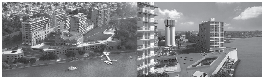
Imagen 6. Concesiones gastronómicas Costa Central

urbanos con espacios recreativos que le otorgaría densidad y aprovechamiento intensivo del espacio público local. Tal circuito amalgamaría un paseo peatonal de casi cinco kilómetros de espacios verdes que cifran simbólicamente al espacio público como un sitio seguro, abierto pero habilitado para el consumo de sectores medios y altos a través de la oferta gastronómica brindada por los espacios concesionados por el municipio para su explotación comercial (Imagen 6). De esta forma, la mediación de la gastronomía asegura una serie de usos, estableciendo una relación “apropiada” para todas las instalaciones a proyectarse en el área.