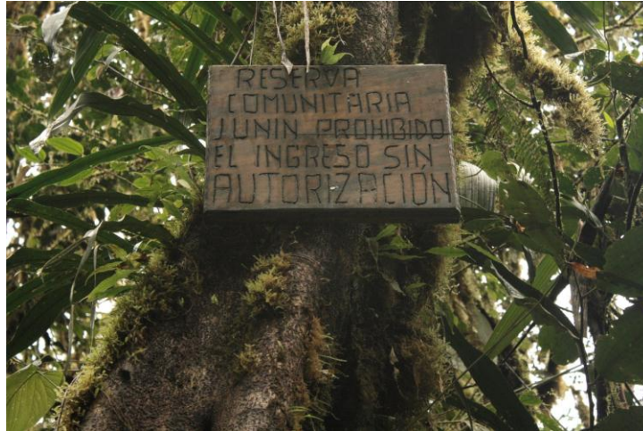
Foto 1. Restringido el acceso no autorizado.

desterritorialización y reterritorialización asociada con la megaminería despertó un proceso de reterritorialización activa.