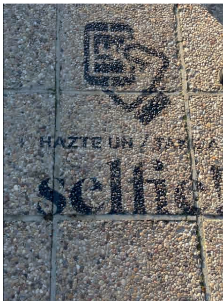
Figura 1: Ponto de parada para Selfie em Toledo (Espanha).

Porém, com o surgimento da tecnologia digital, a tecnologia na produção de vídeo ganhou duas vantagens: qualidade no resultado final e distribuição do mesmo por meios sociais. O cidadão superou a condição de produtor, passando a ser também um distribuidor do seu próprio conteúdo. Além disso, esse conteúdo passou a contar com outro diferencial, declarado por Marc Augé (2007) como o principal: a mobilidade. O antropólogo descreve, em um de seus mais recentes estudos, o cidadão contemporâneo como um ser que tem a mobilidade como fundamentação de seu caráter. Tal leitura do cidadão contemporâneo se aproxima das propostas de Zygmunt Bauman, que define a sociedade atual como líquida (2001)