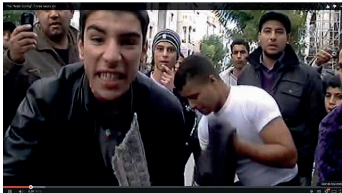
Figura 3: Entrevista a cidadãos com estética incomum, na Síria, também pela categoria “Registro Factual” 3 .

Um grupo de produção de conteúdos cidadãos que adota a categoria “Realidade em Tempo Real” é o Mídia NINJA, que ganhou popularidade no movimento FreePass , ocorrido no Brasil em 2013. Os vídeos eram gravados a partir de dispositivos móveis modelo iPhone conectados a um computador portátil carregado em uma mochila. Dessa maneira, os dispositivos móveis, que possuíam tecnologia de conexão 3G, tinha maior capacidade de bateria, já que o próprio computador carregava sua bateria. Esses registros também foram utilizados por algumas emissoras de televisão do Brasil, além de emissoras internacionais (Gonçalves, Renó y Miguel, 2013), mas sua circulação real ocorreu nos meios sociais.